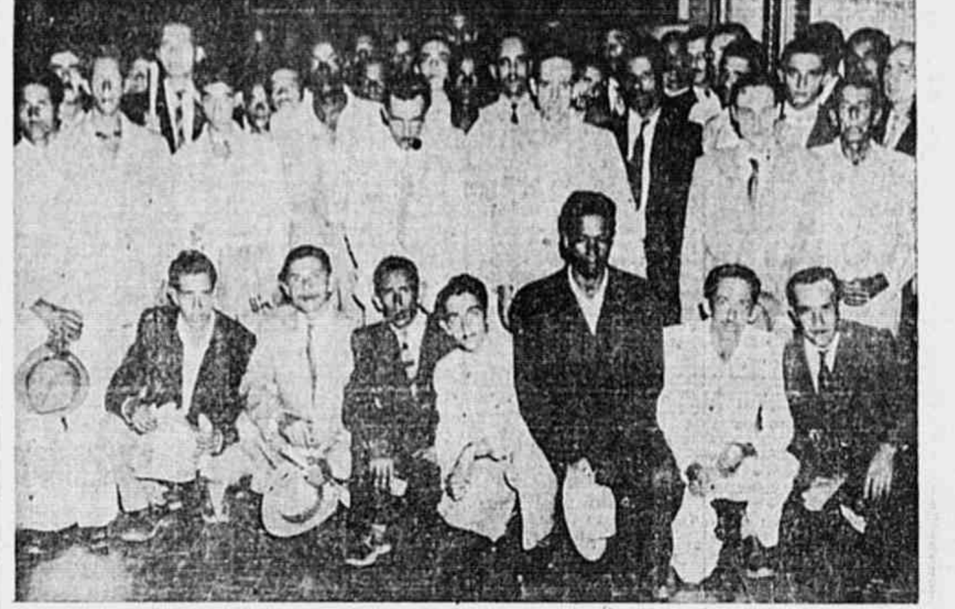
A numerosa comissão de metalúrgicos que ontem esteve na redação da TRIBUNA POPULAR