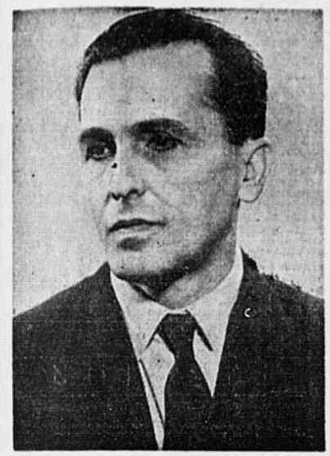
Prestes, guia do proletariado e do povo

Sob a bandeira da unidade proletária, da União Nacional, de luta pela paz e contra o imperialismo