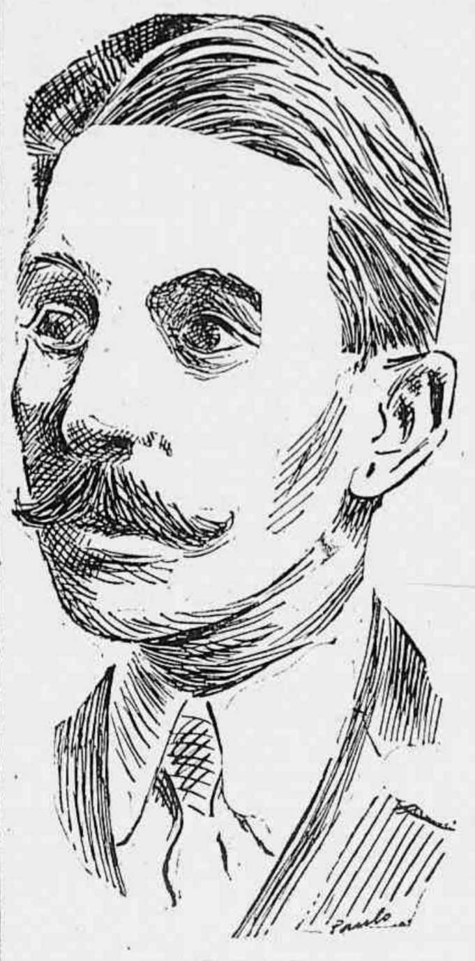
Euclides da Cunha

O genial autor de "Os Sertões" participou das comemorações da data do Trabalho — Redigiu um manifesto lançado em 1901, em São José do Rio Pardo