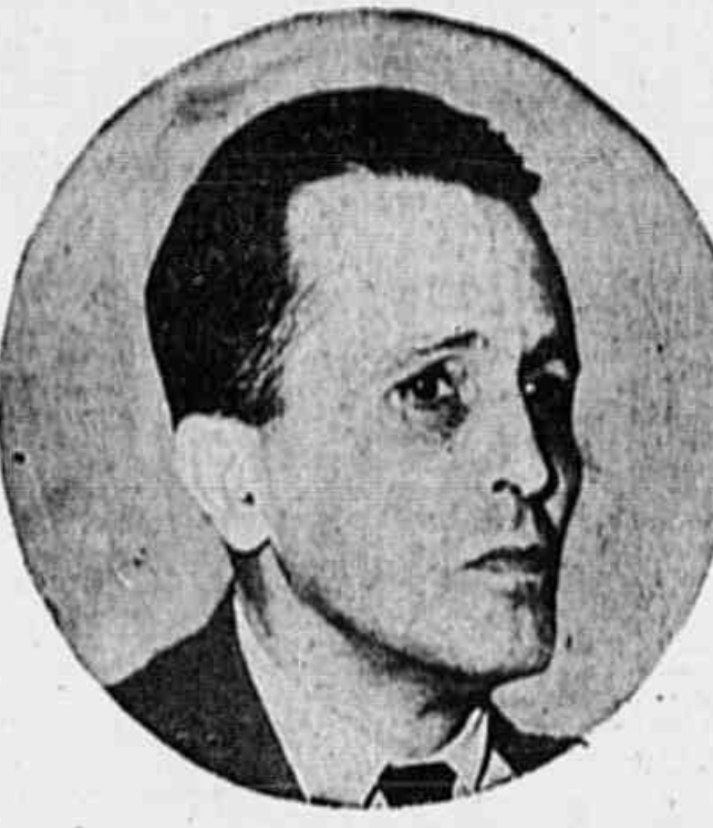
Luiz Carlos Prestes

Tendo ido a São Paulo, no dia 24, a fim de dirigir a palavra ao povo paulista, o Comendador do Voz do Trabalhador, o Senador Luiz Carlos Prestes, fez uma entrevista coletiva à imprensa paulista sobre o problema mais importante do Brasil. Antes mesmo de falar aos jornais paulistas, o Secretário Geral do P. C. B. recebeu, na sede do Comitê Estadual de São Paulo a imprensa paulista respondendo de maneira clara e incisiva a todas as perguntas que lhe foram feitas. Publicamos abaixo, dada a atualidade de que se revestem os trechos principais da entrevista de Prestes.