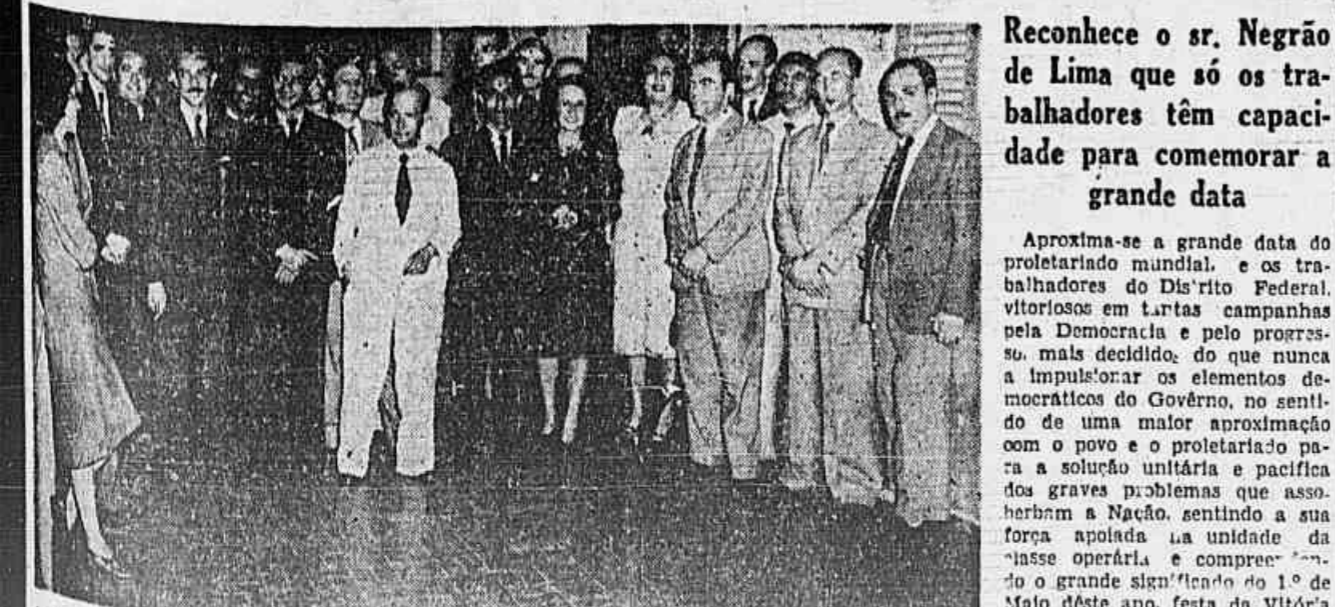
Comitê de dirigentes e líderes sindicais em nossa redação, após ter ouvido as declarações do Ministro do Trabalho

Reconhece o sr. Negrão de Lima que só os trabalhadores têm capacidade para comemorar a grande data