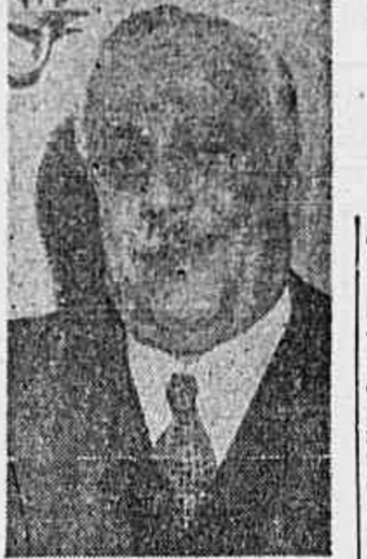
Deputado Otavio Mangabeira