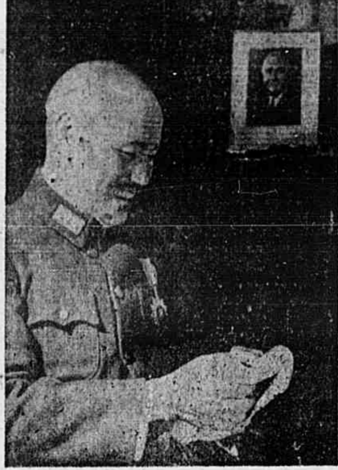
Chiang-Kai-Shek tem, em sua residência, o retrato de Roosevelt, mas não quer dar plena liberdade ao seu povo