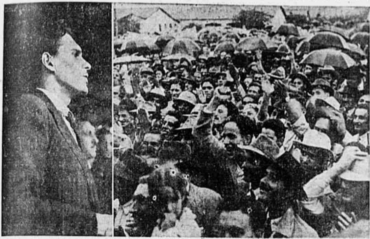
O deputado comunista Alcides Sabença, operário de Volta Redonda, quando discursava, e parte da multidão que o aplaudia com entusiasmo e ao líder do proletariado e do povo brasileiro, Luiz Carlos Prestes

Desmascarados mais uma vez, os falsos democratas do PSD e do Partido Trabalhista