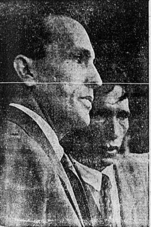
Prestes, em Volta Redonda