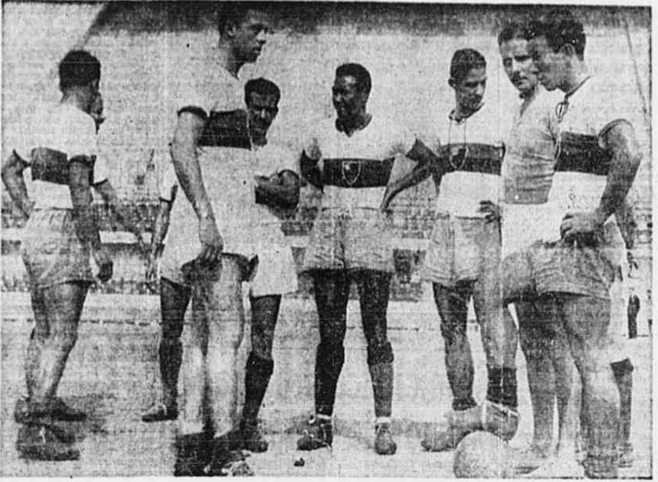
Players rubro-negros que participarão do "apronto" de hoje em Niteroi