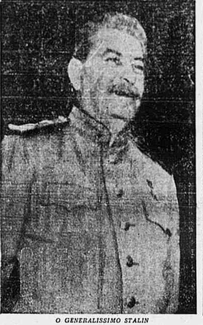
O GENERALÍSSIMO STALIN

Churchill está prejudicando a causa da paz e da segurança? — Sim, incontestavelmente. Em substância, Mr. Churchill se acha colocado na posição de alimentador de guerra. Mr. Churchill não está sozinho, aqui. Tem amigos, não somente na Inglaterra, mas também nos Estados Unidos da América. A esse respeito, lembra-nos notavelmente Hitler e os seus amigos. Hitler começou a provocação de guerra anunciando a teoria racial e declarando que somente o povo de língua alemã representava uma nação intrinsecamente valerosa. "O sr. Churchill começa a acenar com a guerra também por uma teoria racial, sustentando que somente as nações de fala in-