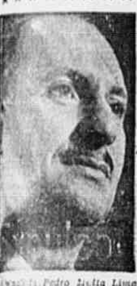
Expulso do Paraguai pelo ditador Morinigo