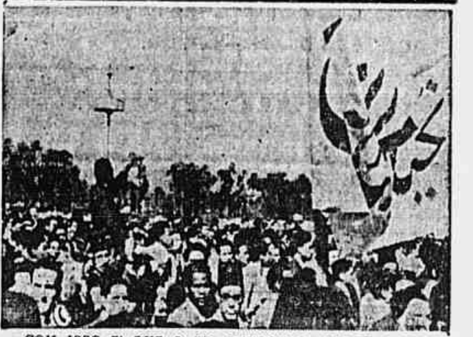
COM ISSO É QUE O SR. CHURCHILL PERDE A CALMA — Al temos, no Cairo, uma demonstração patriótica, promovida por cidadãos egípcios, contra o imperialismo britânico.

TOQUIO, 8 (AFP) — Yakov Mikh, que foi o último embaixador da URSS no Japão, chegou ontem à esta capital. O diplomata soviético volta à terra nipônica como conselheiro político do general Deryyanko, chefe da delegação soviética junto ao Comitê de Controle do Japão, que se acha aqui desde o dia 8 do mês passado.