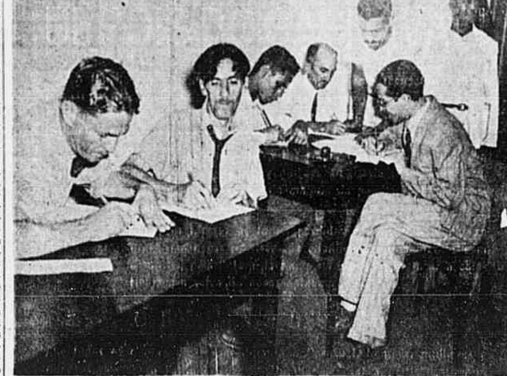
Um aspecto do movimento no Posto Eleitoral do P. C. B.