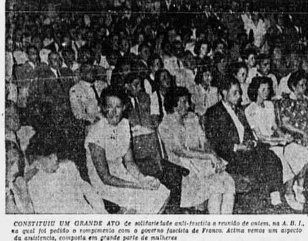
CONSTITUIU UM GRANDE ATO de solidariedade anti-fascista a reunião de ontem, na A. B. I., na qual foi pedido o rompimento com o governo fascista de Franco. Atima vemos um aspecto da assistência, composta em grande parte de mulheres