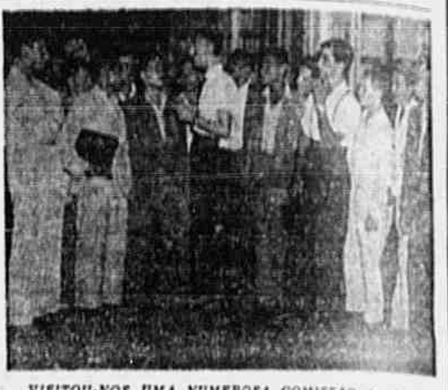
VISITOU-NOS UMA NUMEROSA COMISSÃO de camponeses que veio, por nosso intermédio, externar seu protesto contra a reunião ilegalmente convocada para ontem, pelo Sr. Prefeito, para a deliberação tomada na assembleia anterior de 23 de fevereiro, sobre a participação do mesmo no Congresso Sindical, ao qual a referida junta governativa não teve a liberdade de convocar, e a qual, em verdade, apresentava os visitantes, o objetivo da convocação era de obter o aumento de salários aprovada naquela mesma assembleia, sem haver a referida junta governativa elementos influentes que mais são do que agentes dos empregadores. Outro fato que ocorreu a reprovado das eleições foi a presença, na mesa que dirigiu os trabalhos de ontem, do ex-presidente do Sindicato, que acha afastado destas funções por irregularidades financeiras das na sua administração. A análise da assembleia de ontem, motivada pelo fato de não ter sido apresentada a lista de estatutos dos associados que a convocaram, como o estatuto do Sindicato, quando, contudo, marcada para a próxima quarta-feira, uma nova assembleia, para a qual a comissão que nos visitou encarece a necessidade do comparecimento dos seus camponeses. O título que se fez um aspecto da comissão em palestra com a nossa reportagem.

geral; 2º — Direito da greve; 3º — Problema sobre o arrendamento da terra; 4º — Educação e proteção à infância; 5º — Saúde e proteção à velhice; 6º — Direito de férias; 7º — Direito ao aviso prévio; 8º — Documentação para sua granja; 9º — Proteção às mães camponesas; 10º — Meio de adquirir ferramentas; 11º — Melhor meio de habitação; 12º — Meio de crédito justo ao Dinheiro do Brasil para o pequeno agricultor; 13º — Ensino agrícola ao filho do camponês; 14º — Diminuir os impostos ao pequeno agricultor; 15º — Horário de trabalho; 16º — Fundar cooperativas; 17º — Sindicato para os trabalhadores do campo; 18º — Escolas primárias para os filhos dos camponeses inteiramente gratuitas e em todas as fazendas.