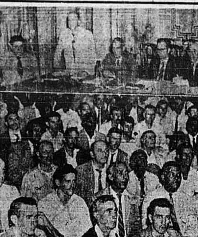
A mesa que presidiu os trabalhos e parte da assistência, durante a assembleia de ontem

perpetração desse brutal atentado contra um jornalista de prestigio continental não os de haver realizado supostas reuniões com trabalhadores, estudantes e políticos do Paraguai.