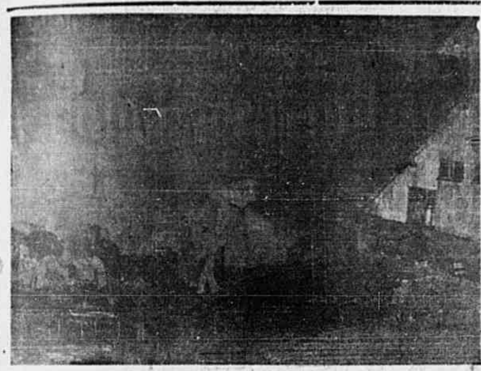
VALENTO INCENDIO IRROMPEU, ONTEM, á noite, na rua Santana, tomando logo proporções gigantescas, ameaçando os quarteirões vizinhos. Os doentes de um hospital próximo, foram evacuados. O sinistro atraiu para o local, onde os bombeiros lutavam contra as gigantescas chamas, milhares de pessoas. O clichê fixa um flagrante do acidente, tendo-se os bombeiros em plena atividade. — (NOTICIARIO NA 2.ª PAGINA)