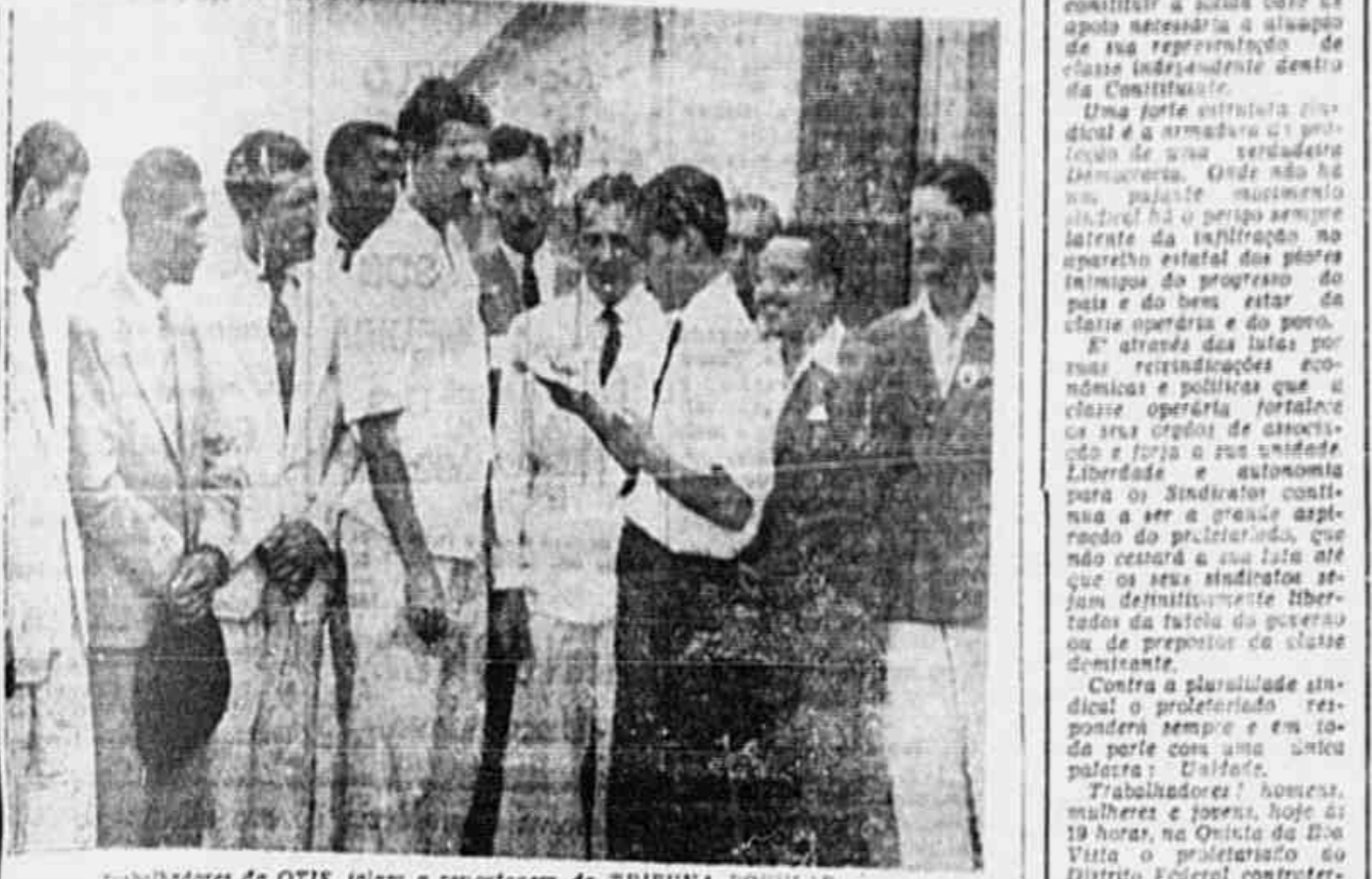
Trabalhadores da OTIS, Jalam a reportagem da TRIBUNA POPULAR

CASO A EMPRESA A ATENDER O PEDIDO DE AUMENTO - CASO PARA SOLUÇÃO, SERÁ DECRETADA A GREVE SEGUNDA-FEIRA