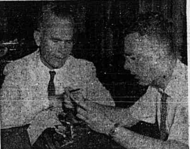
O deputado comunista Gregório Bezerra, falando á reportagem

Presos cerca de 50 jovens, dos quais um foi barbaramente espancado — Manobra para atemorizar o povo e impedir o êxito do grande comicio de ante-ontem — Os srs. Macedo Soares e Oliveira Sobrinho, dois saudosistas do terror do Estado Novo — Fala sobre os acontecimentos da Paulicéa o deputado Gregorio Bezerra