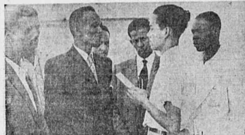
Trabalhadores da Ilhama, que só irão à greve, em último caso, em vista da nossa redação. — (Noticiário na 5.ª Página)

ANO II * N. 205 * Av. Aparício Borges, 207-13. * Sabado, 19-1-1946