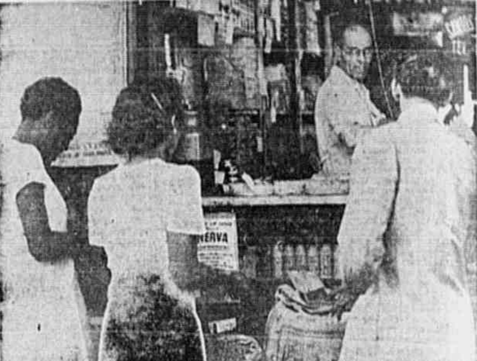
O comerciante comprando nos freqüentes que não há charque. Esse fato ainda mais dificulta o problema das donas de casa, que não podem fazer milagres.

Não é possível chegarmos à situação de, sendo o Brasil grande produtor de charque, não se encontrar nos estabelecimentos comerciais do Rio ou nas suas feiras livres um quilo sequer desse artigo. A carne seca existe, restando aos responsáveis tomarem energias providências para que ela volte a ser oferecida ao consumidor carioca.