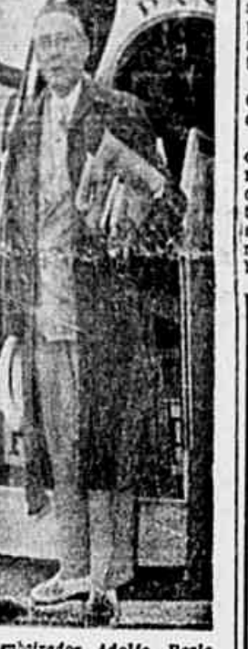
O embaixador Adolfo Berle

Esse não pode mais ser feito abertamente. O importante é saber que existem possibilidades de paz, e em tais condições, o fundamental é lutar, com os partidos comunistas à frente, por essa paz no mundo e em cada um dos nossos países.