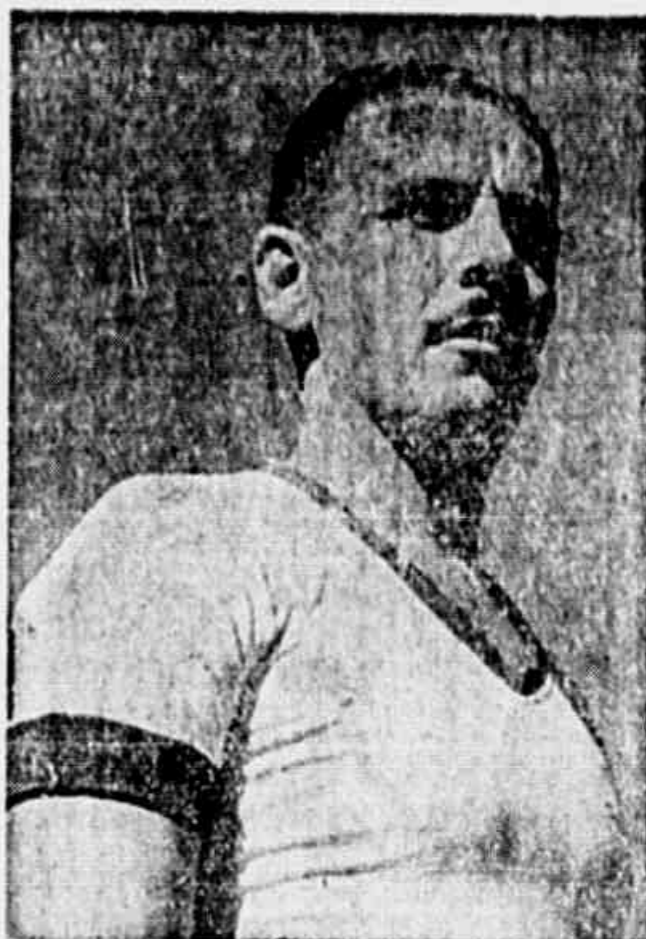
Flavio Costa, técnico da seleção nacional

Este é o critério adotado pela entidade máxima, conforme ficou provado nos casos dos players do São Paulo, no ano passado, Leonidas, Noronha, Laíno e Beto, embora estes tivessem cotados pelo técnico, tiveram de comparecer a Casambi. E a C. B. D. somente concordará com a licença de elementos reconhecidamente incapazes fisicamente.