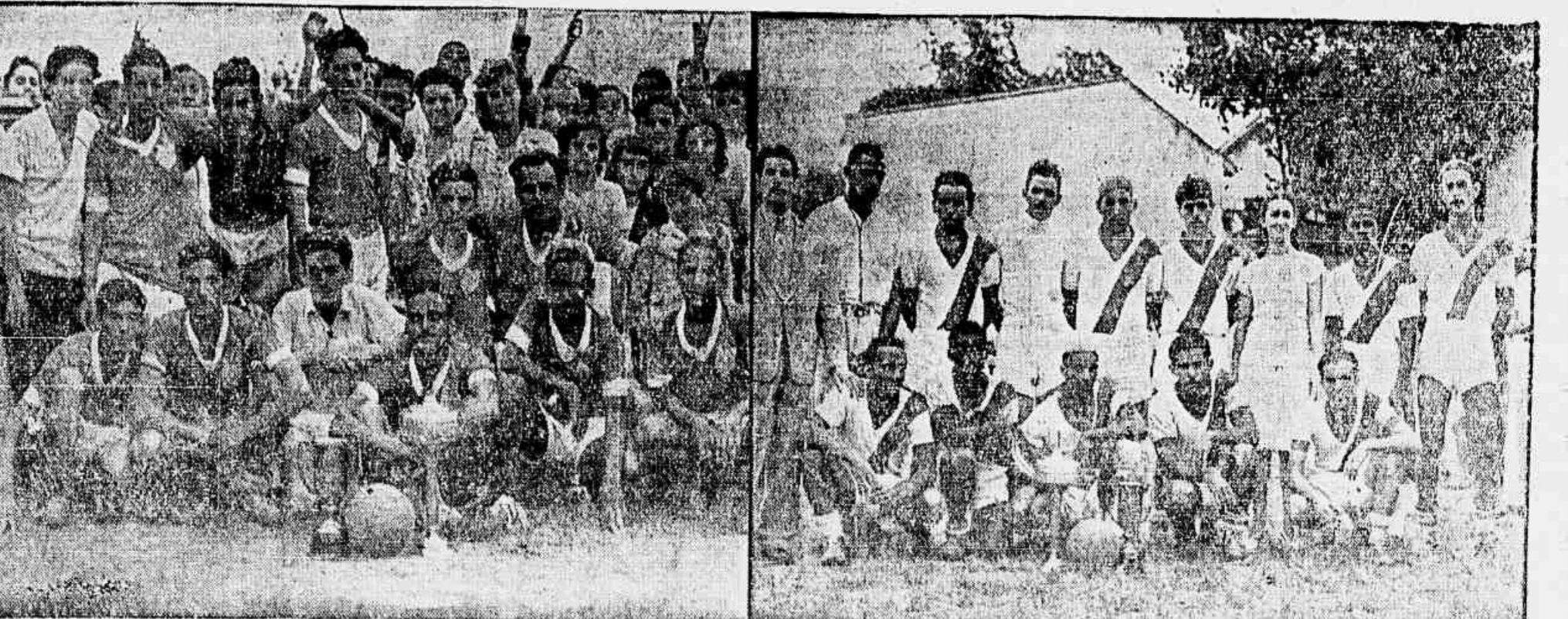
Os quadros do Bento de Abreu e do Rio Comprido, finalistas do Torneio Initium promovido pela Liga Juvenil Vitoria

No campo do Porto Alegre F. C. foi realizado ontem o Torneio Initium da Liga Juvenil Vitoria. Quatorze quadros participaram do certame inaugural da nova entidade, cujo transcorrer foi dos mais empolgantes. Os quadros do Siquira Campos, Bento de Abreu, Rio Comprido, Monte Castelo, Príncipe de Mato B, Ideal, José Bonifácio, Verdun, Primeiro de Maio A, Tiradentes, Montes, Sampaio Ferraz, Pedro Ernesto e Unidos. A competição efetuada sob os auspícios da TRIBUNA POPULAR, foi assistida por público numeroso. Ao vencedor oferecemos artístico troféu, que foi entregue logo após a terminação do encontro. Após partidas equilibradas, onde os concorrentes tiveram oportunidade de exibir os seus conhecimentos futebolísticos, chegaram à final os quadros do Bento de Abreu e Rio Comprido. Na edição de amanhã publicaremos detalhes da competição.