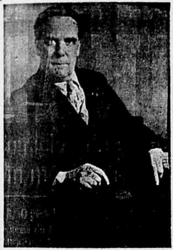
Uma das mais eminentes figuras da ciência no mundo moderno é o professor Piotr Kapitza, do Instituto de Física da Academia de Ciências da União Soviética e cuja fotografia a TRIBUNA POPULAR publica pela primeira vez no Brasil. Além de suas pesquisas sobre a energia atômica que, à frente de um grupo de sábios, estava realizando numa montanha da Arábia, o professor Kapitza deu um passo à frente neste terreno, ao separar as partes componentes dos raios cósmicos, medir sua energia e descobrir um elemento completamente novo e que se decompõe em partículas semelhantes aos prótons. A descoberta do sábio soviético vem trazer uma ajuda decisiva ao aperfeiçoamento da força atômica.

Com este objetivo lança-se ao trabalho a Comissão Nacional de Finanças Grande atividade na sede do Partido Comunista — Os "Selos Luiz Carlos Prestes" e as listas de assinaturas — Numerosas contribuições diretas