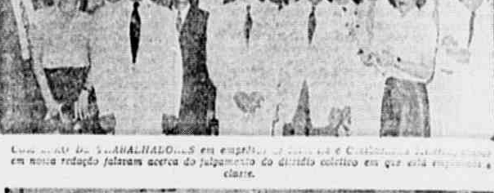
COMISSÃO DE COMERCÍANOS que efectuou a noite redacção, procurando ...