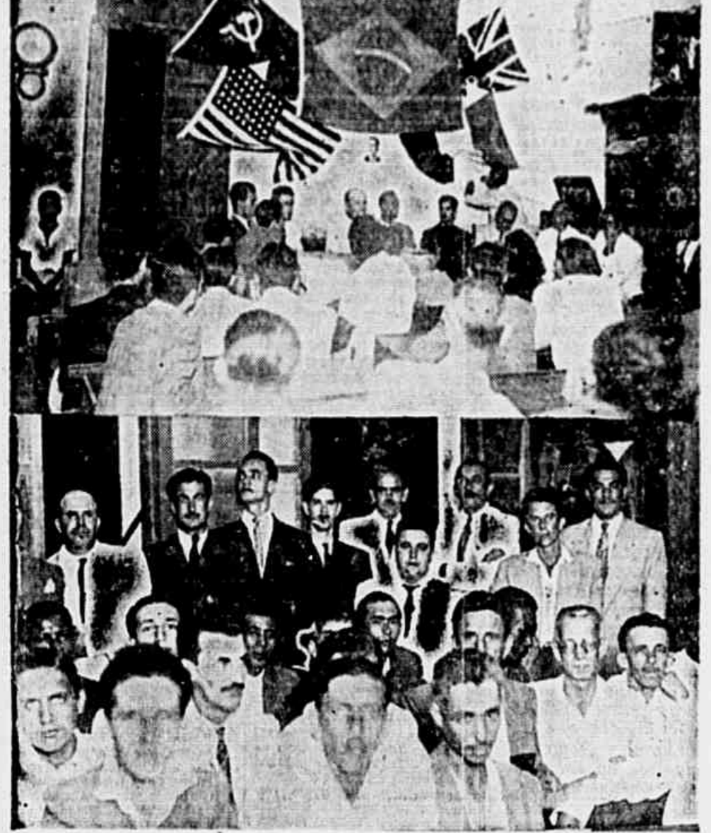
Dois aspectos da solenidade da posse do secretariado do Comité Municipal de Miracema