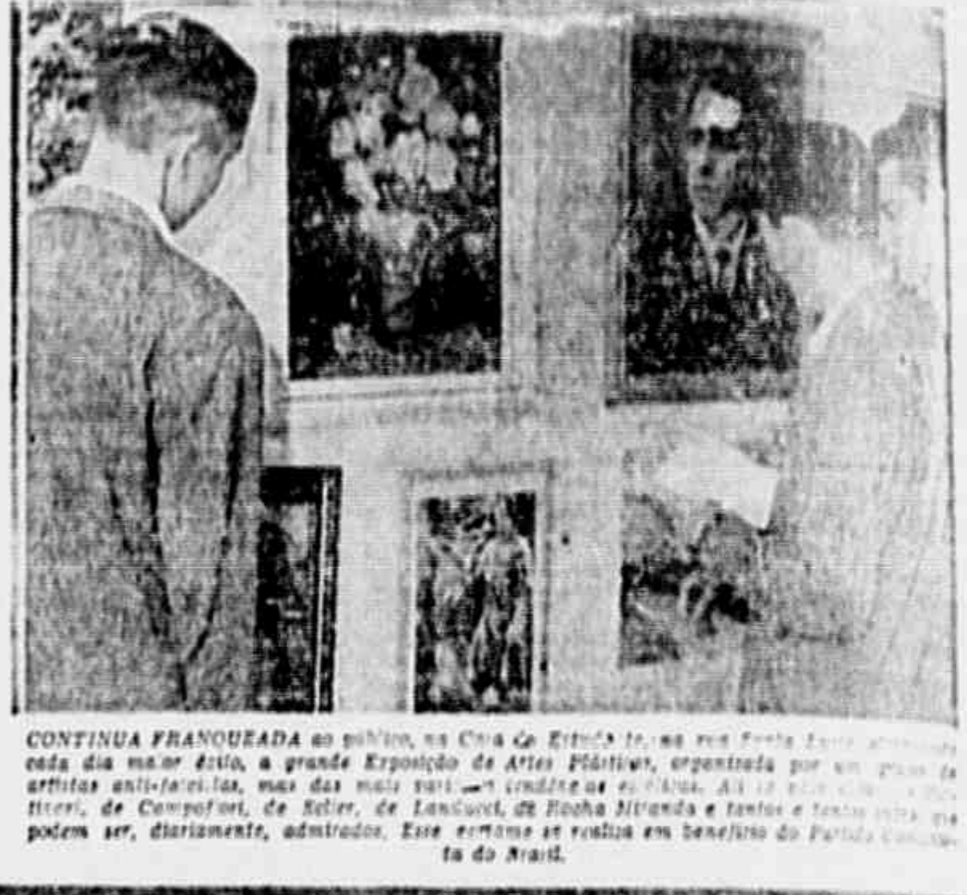
CONTINUA FRANQUEADA ao público, na Casa do Estudante do Brasil, a grande Exposição de Artes Plásticas, organizada por um grupo de artistas anti-fascistas, mas das mais partem a tradição de A. S. ...