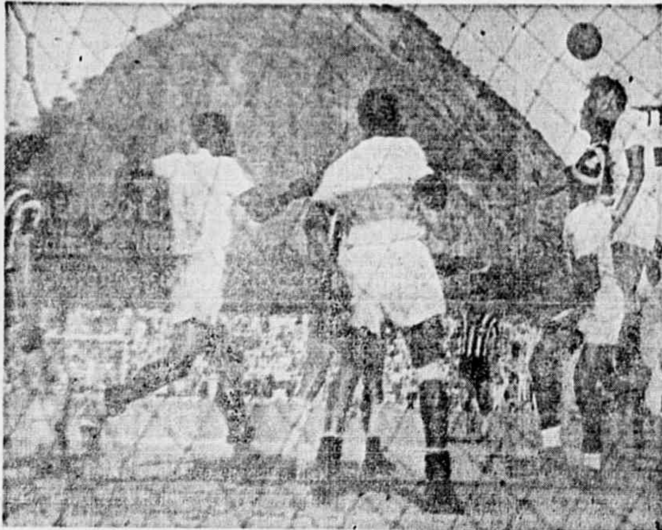
A DEFESA ALVA EM AÇÃO, DURANTE O JOGO DO S. CRISTOVÃO