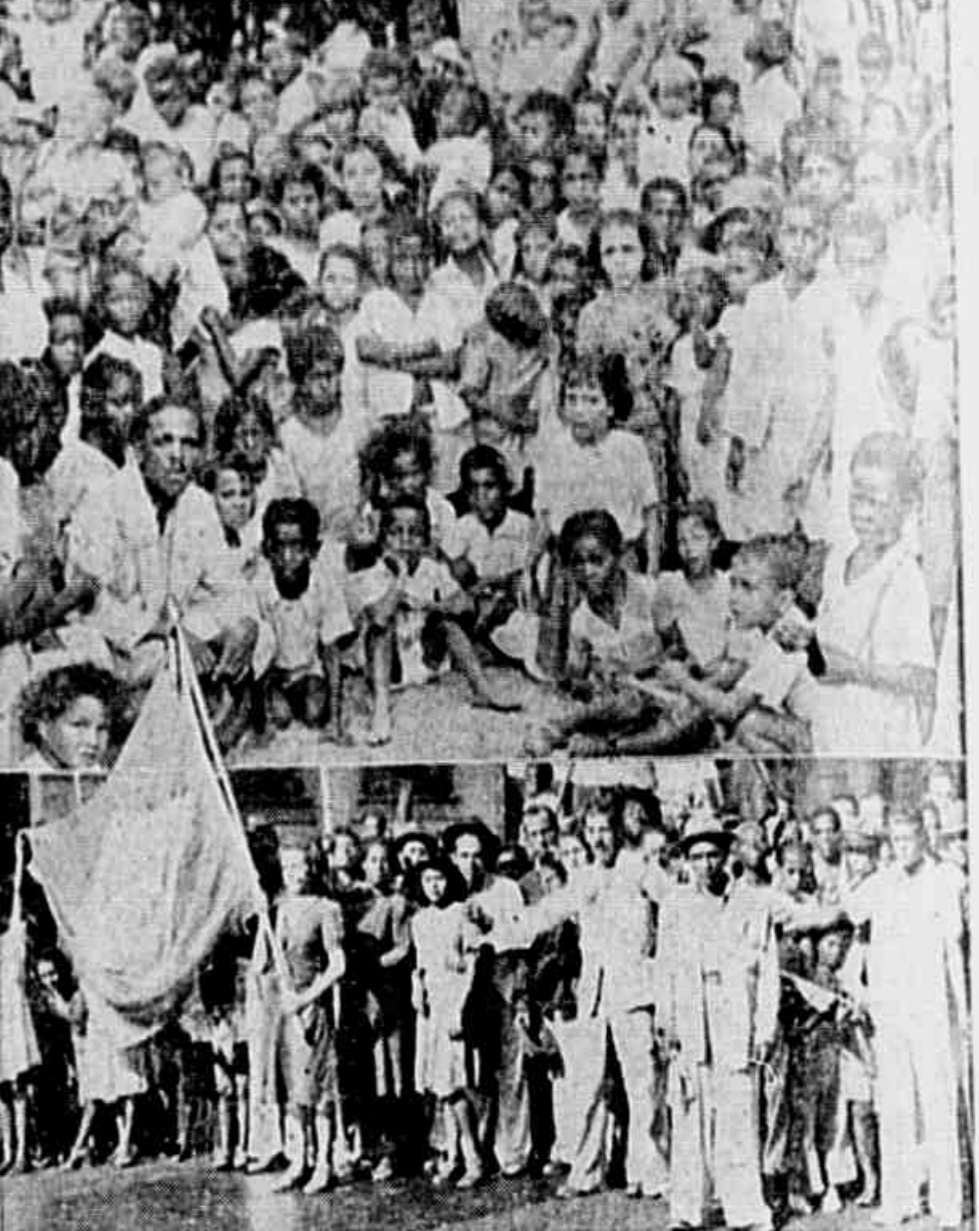
Uma das cenas da impressionante demonstração realizada, pouco antes dos moradores de Jacarezinho chegar em ao Calate.

PROVIDENCIAS CONCRETAS E' evidente que a justa reclamação de tantos brasileiros ameaçados de ficar ao relento deve ser atendida. E é de esperar que a promessa ontem feita aos manifestantes seja transformada em atos concretos que solucionem o caso. Procurando solucionar problemas como esse, atendendo sempre as justas reclamações do povo, os elementos do governo têm estado consolidando seu apoio popular, o que redundará em garantia para a democratização do país, no fator de estabilidade, em segurança contra o advento de regimes fascistas pronunciamentos "de que sul-americano".