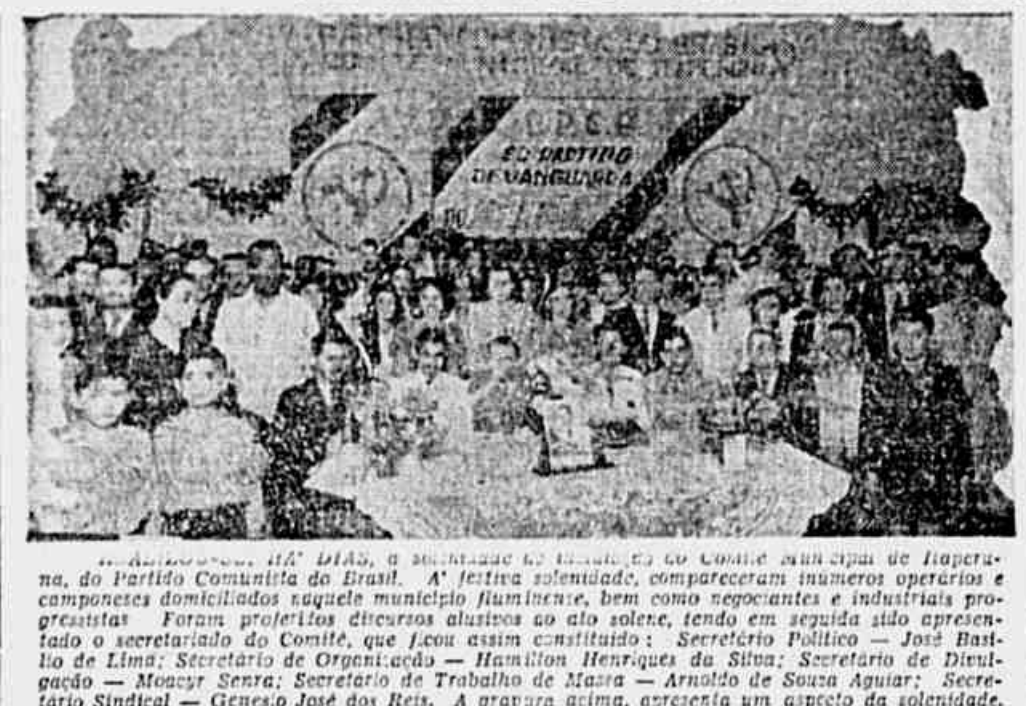
...A REUNIÃO DO COMITÊ MUNICIPAL DE IAPORANA, DO PARTIDO COMUNISTA DO BRASIL...