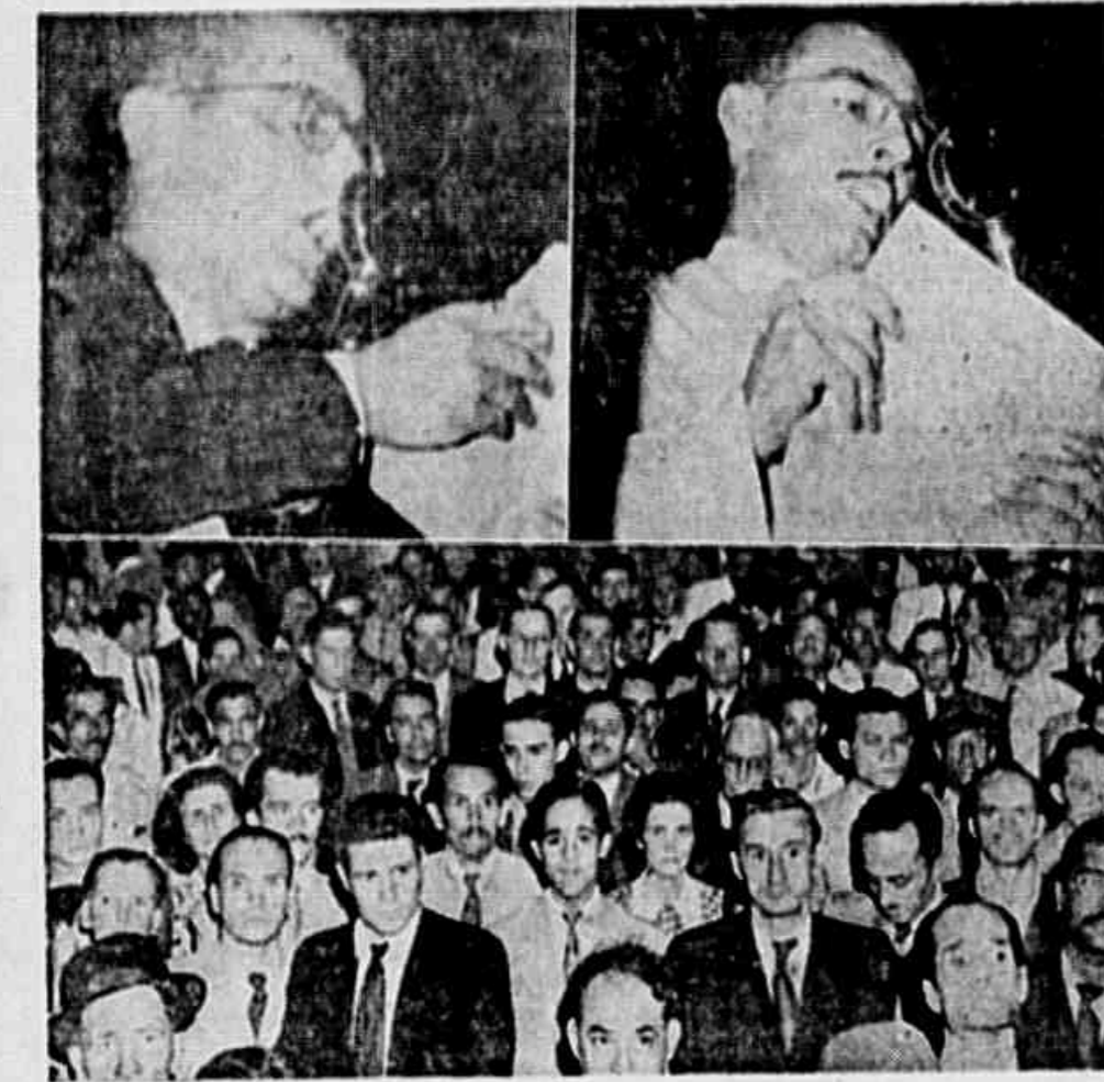
Aspecto do grande comício de domingo, realizado pelo Partido Comunista, no Largo do Machado.