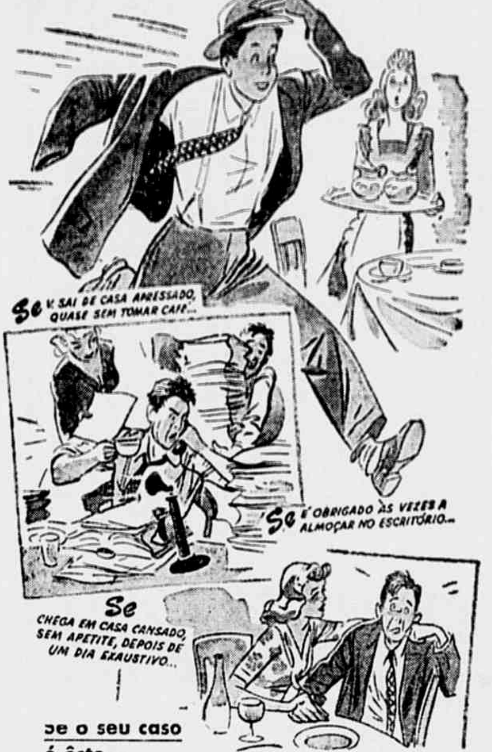
Se V. SAI DE CASA ANHESSADO, QUASE SEM TOMAR CAFÉ...