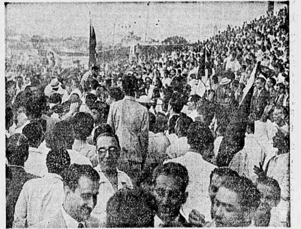
VASCO, CAMPEÃO DE 45 - São Januario, ao ser coroado o campeão do futebol de São Cristovão, o delírio foi alucinante. Os torcedores invadiram o campo, carregando em triunfo o técnico, jogadores e dirigentes. Na gravura, alguns cruzmaltinos comemorando a vitória.

Embarcarão hoje com destino a Casambá, dois emissários do C. B. D. São Cristovão e Bonussuco an-tecipado para a noite de sábado. O Vasco tudo fará para conquistar o campeonato de Terceira e Mar.