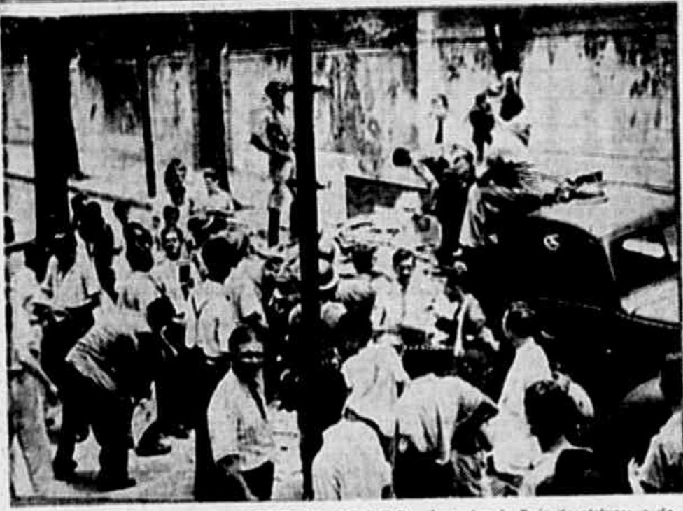
Na sede do Comitê Metropolitano do P.C.B., elementos do Exército efetuam a devolução de móveis e materiais de propaganda que foram retirados, quando forças militares ocuparam a sede depois do fechamento da Tribuna Popular. Os militares ocuparam a sede depois do fechamento da Tribuna Popular.

Apesar do Ministro da Justiça ter afirmado que ninguém seria preso por ser comunista, foram detidos, cerca de 400 militantes do P.C.B. ★ 200 prisões de membros de outras organizações políticas ★ Os acontecimentos