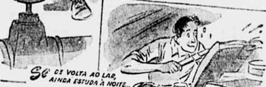
Se DE VOLTA AO LAR, AINDA ESTUDA À NOITE...