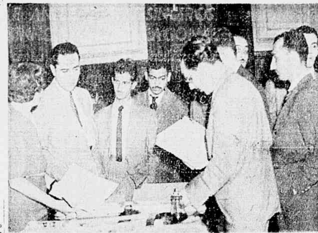
No Tribunal Superior Eleitoral, a funcionária encarregada do serviço, recebe a lista com as 14 mil assinaturas de eleitores do P.C.B., tendo-se os representantes da imprensa

Em vista da situação criada para os Sindicatos com a brusca paralisação de todas as atividades sindicais em virtude das disposições contidas na Circular de emergência passada, distribuída pelo Ministério do Trabalho a reportagem da TRIBUNA POPULAR procurou ouvir, na tarde de ontem, do próprio ministro, cel. Carneiro de Mendonça, a confirmação de que aos sindicatos seria, de pronto, devolvidas as liberdades suspensas