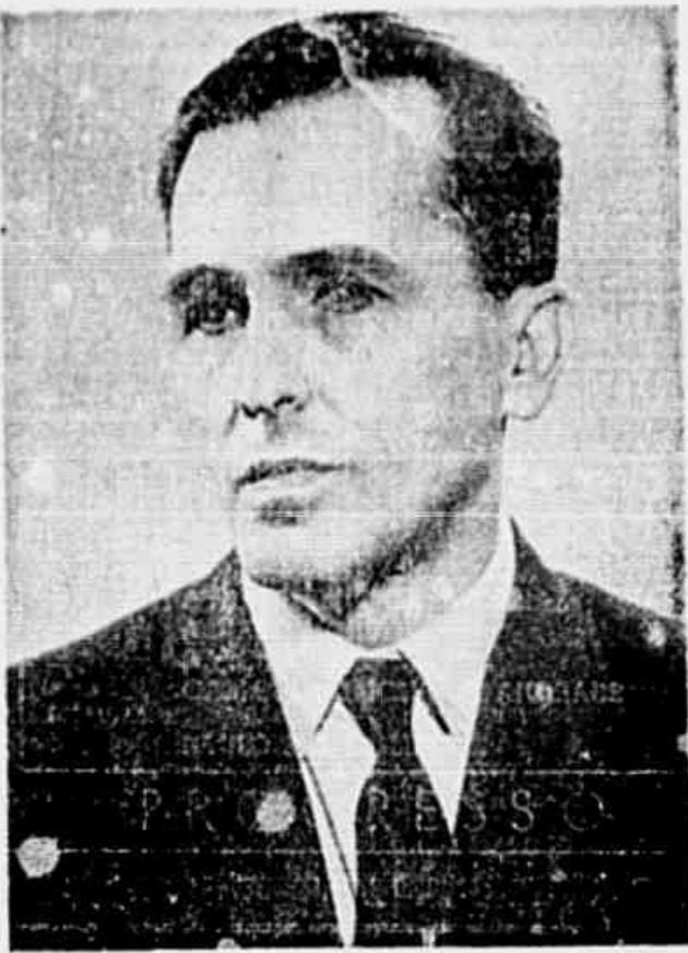
(CONCLUI NA 2ª PAGINA)

O sr. Getúlio Vargas preferiu, no entanto, ceder aos fascistas do governo. Traiu ao povo, permitindo que se articulassem as forças da reação, inclusive as dos dois candidatos militares à Presidência da República, que, afinal, unidas numa frente comum, desfecharam o golpe militar que levou a Nação ao risco iminente da guerra civil, do terrível e desnecessário derramamento de sangue de seus filhos, que só não aconteceu devido à atitude firme e consequente do nosso Partido e de outras forças populares, que não cessaram durante meses de alertar o povo, o proletariado e as correntes democráticas, contra o perigo dos