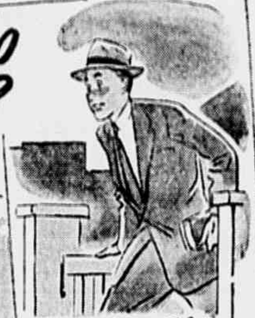
Se V. SAI DE CASA PARA O TRABALHO, MUITO CÉDO...