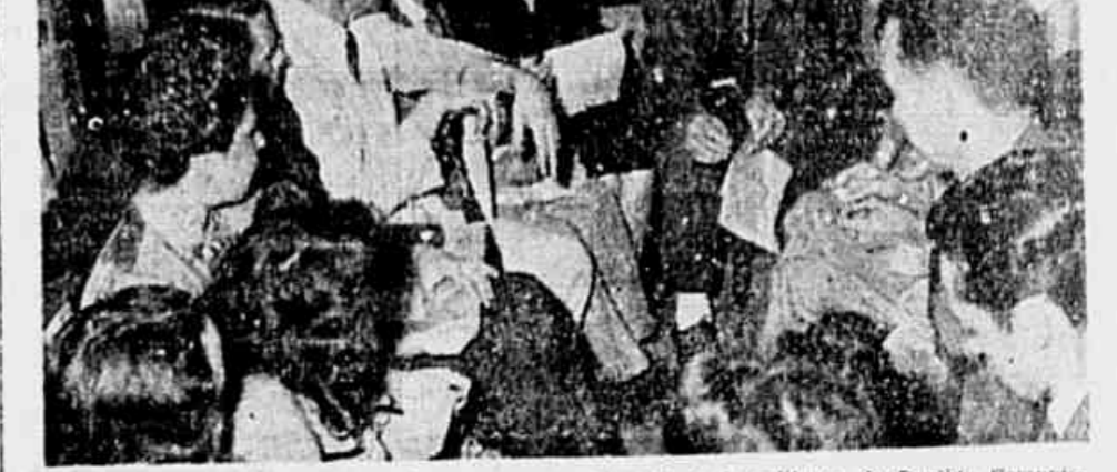
Na sede da Rua Conde Lage, quando muitos dos dirigentes metropolitano do Partido Comunista, era grande a atividade, com aquele organismo partidário em pleno funcionamento.