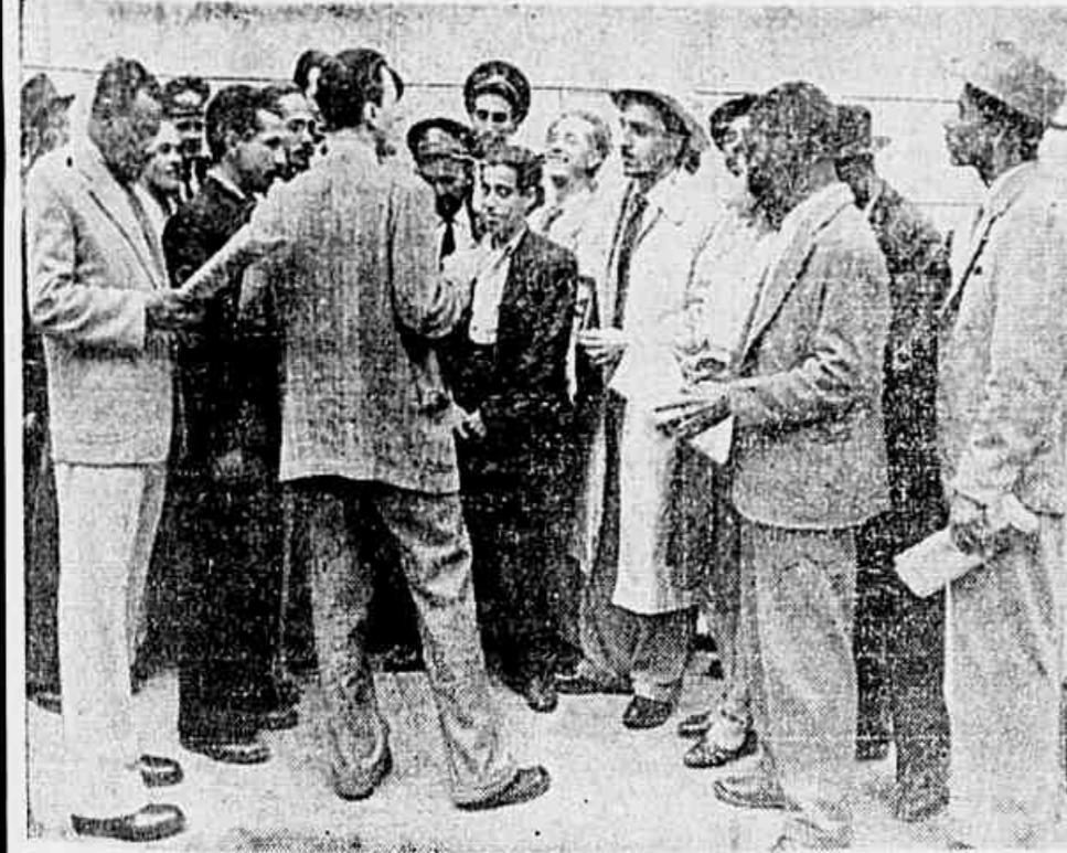
Em plena rua, nossa reportagem ouviu homens do povo, sobre a medida tomada contra a "TRIBUNA POPULAR"

Falam elementos de varios setores sobre a suspensão da TRIBUNA POPULAR. "Seu reaparecimento foi para nós um grande acontecimento. A satisfação foi reforçada ao vermos na 1.ª página a entrevista de Prestes. "Só a "Tribuna" atende aos nossos anseios"