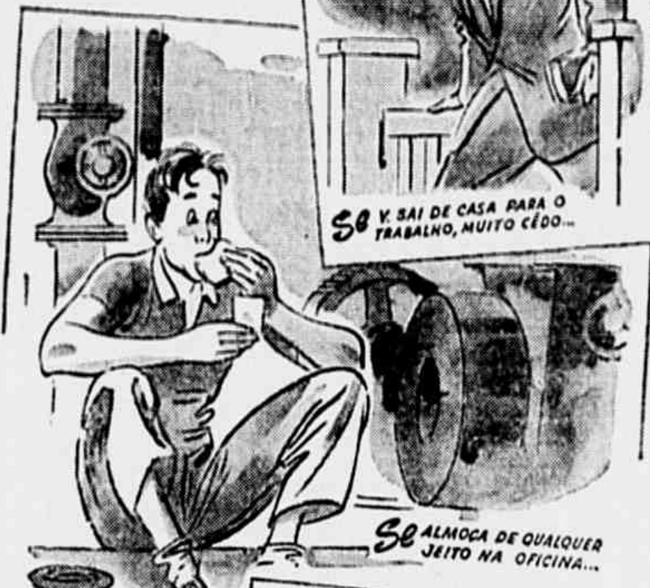
Se ALMOÇA DE QUALQUER JEITO NA OFICINA...