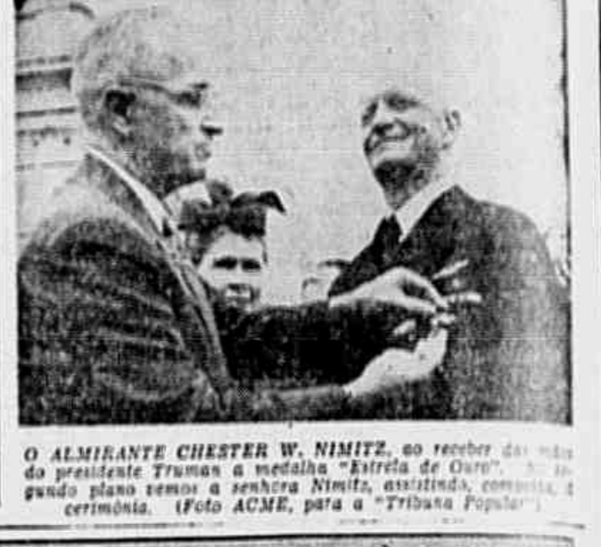
O ALMIRANTE CHESTER W. NIMITZ, ao receber da mão do presidente Truman a medalha "Estrela de Ouro", em uma cerimônia.