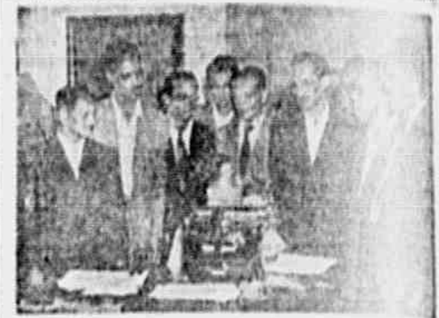
Os trabalhadores da Light em nossa redação.

Em nossa redação, uma comissão de emissão da Companhia de Carris, Luz e Força do Rio de Janeiro