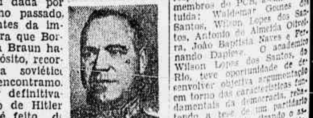
U. R. S. S. — A última palavra das autoridades soviéticas sobre Martin Bormann foi dada por Zhukov, quando, em junho passado, declarou aos correspondentes da imprensa nacional e estrangeira que Bormann, tal como Hitler, e Eva Braun haviam desaparecido. A propósito, recorda-se que o cabo de guerra soviético disse textualmente: "Não encontramos um corpo que pudesse ser definitivamente identificado como o de Hitler. Não pouco se sabe que é filho de Bormann". Não obstante, acreditamos em Moscou que se Hitler e Eva Braun se suicidaram Martin Bormann lhes seguiu a atitude. — (U. P.). — O "Izvestia" disse que o governo argentino "manobra febrilmente para sustentar o poder, e que está preparando uma farsa eleitoral para novembro; porém com uma "pequena" condição, de que Perón seja eleito". Acrescenta que os regimes pro-fascistas, que amparam e multiplicam hitleristas, constituem perigo indiscutível a nível geral e a causa das nações unidas. O ex-duto hitlerista no hemisfério ocidental deve ser destruído em bem de todos os povos amantes da paz". — (U. P.).