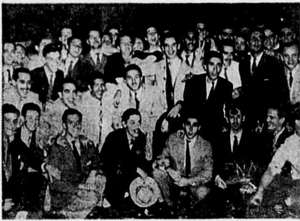
CRIDA A FACULDADE NACIONAL DE ARQUITETURA — Per decreto do Presidente da República, a Escola Nacional de Arquitetura passou a denominar-se Faculdade Nacional de Arquitetura, que terá por finalidade: ministrar o ensino da arquitetura e de urbanismo, visando a preparação de profissionais altamente habilitados. Além disso realizará estudos e pesquisas nos vários domínios técnicos e artísticos, que constituem objeto de seu ensino. A Faculdade Nacional de Arquitetura manterá dois corpos separados: o de arquitetura e o de urbanismo. O título de doutor em arquitetura, em urbanismo, será conferido ao candidato que, além das provas, tiver sido aprovado em defesa de trabalho original de notável valor. A Congregação da Faculdade Nacional de Arquitetura será constituída pelos professores catedráticos próprios do curso de arquitetura e ministrada pela Escola Nacional de Belas Artes. Justificando a criação do novo estabelecimento de ensino superior, o ministro Gustavo Capanema declarou uma longa exposição de motivos ao chefe do Governo. Por esse motivo, os estudantes de arquitetura promoveram, ontem à tarde, na rede da antiga Escola, uma festiva manifestação em que foram queimadas numerosas joguetes e bombas. A gravura acima apresenta um aspecto da festividade.

ANO I * Rio de Janeiro, Sábado, 1 de Setembro de 1945 * N.º 69