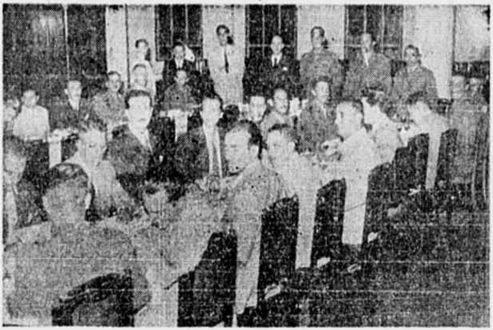
Um aspecto do jantar de ontem, no Clube Militar, promovido por oficiais do 3.º Batalhão do Regimento Sampaio, heroica unidade expedicionária.