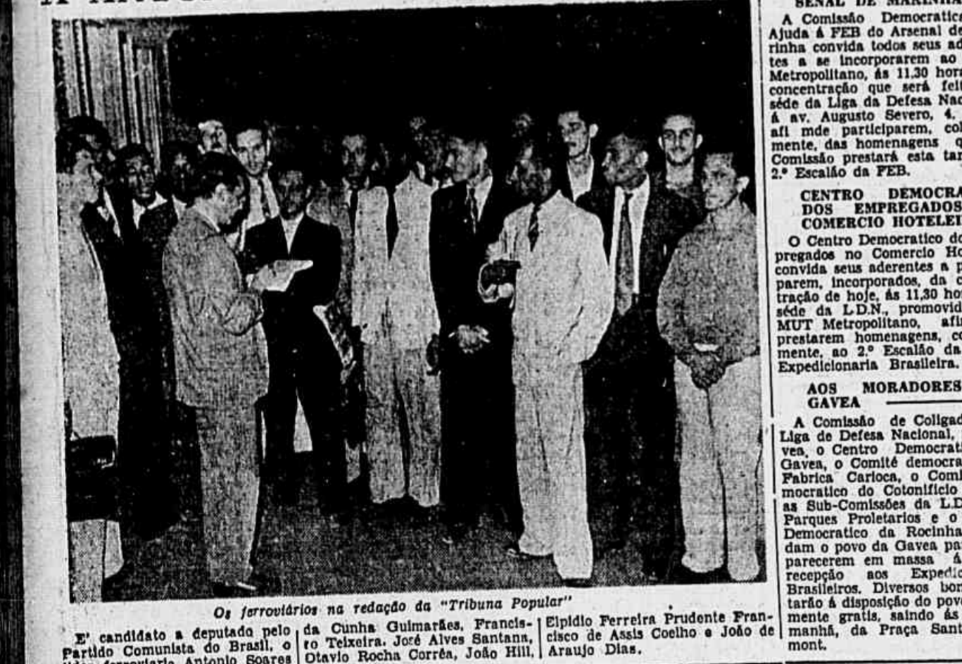
Os ferroviários na redação da "Tribuna Popular".