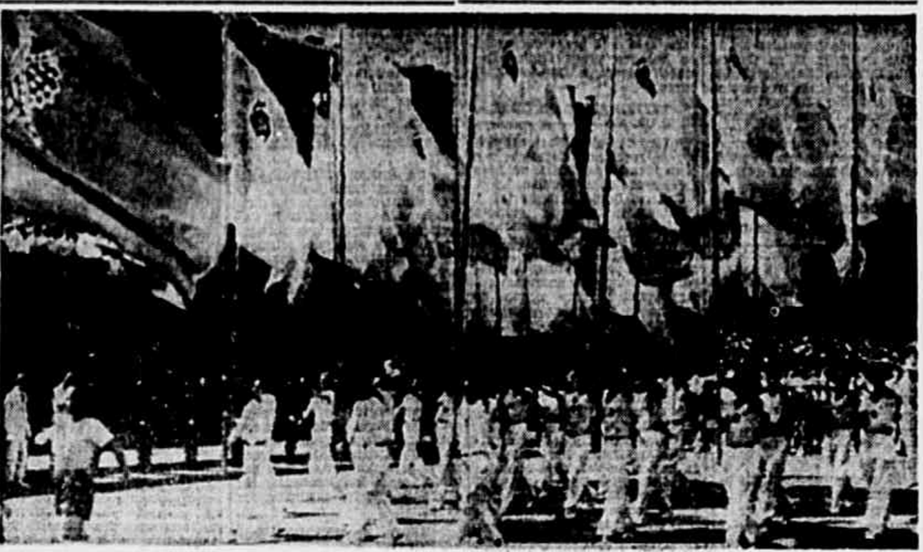
OS ESPORTES NA PARADA DA VITÓRIA NA U. R. S. S. — Moscou — Agosto — — As representações esportivas soviéticas, no dia da parada da vitória, comemorativa da queda da Alemanha, desfilarão na Praça Vermelha, sob aplausos do povo russo. Na radio-foto acima, aparecem os porta-bandeiras, marchando orgulhosamente pela grande praça da capital da U. R. S. S.