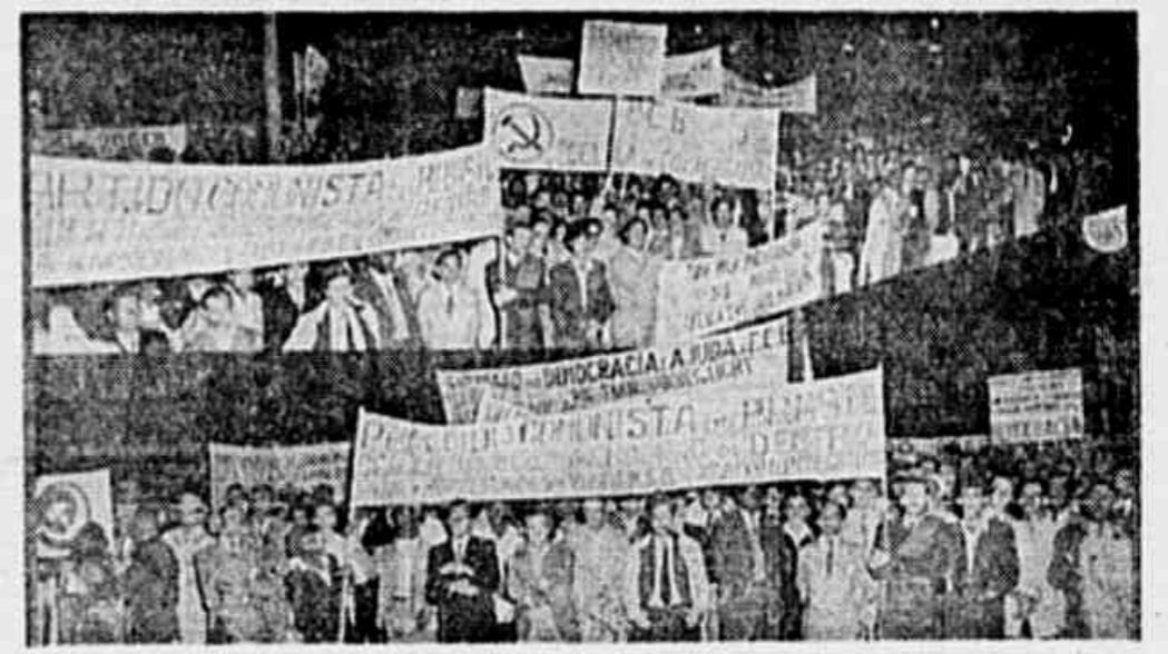
Dois aspectos da massa popular, vendo-se as faixas e cartazes das organizações comunistas e dos Comitês Democráticos

Para marcharmos de fato para a democracia temos que pôr de lado a Carta de 10 de Novembro, afirmaram os oradores entre aplausos da multidão — Comemorando o triunfo total da democracia contra o germano-fascismo no campo militar, o Partido Comunista do Brasil realizou, ontem, à tarde, na Esplanada do Castelo, com uma grande participação da massa, de todas as células do P. C. B. do Distrito Federal, dos Comitês Populares Progressistas, das organizações do proletariado e do povo, o grande Comício da Vitoria. Não obstante a ameaça do tempo nublado grande multidão compareceu à concentração democrática, plena de entusiasmo, vibrando a todo o instante em que os oradores faziam referências à gloriosa Força Expedicionaria Brasileira, à União Soviética, ao papel decisivo dos exércitos das Nações Unidas, ao líder do povo brasileiro, Luiz Carlos Prestes. Exaltação