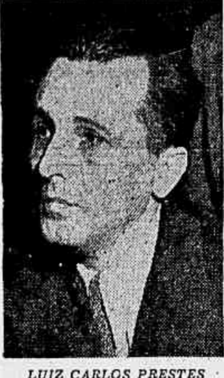
LUIZ CARLOS PRESTES

Em telegrama de agosto de 1942 Prestes aponta o caminho do Brasil na luta mundial contra o fascismo Quando os barbares nazistas torpedearam cinco navios brasileiros que em tarefas pacíficas trafegavam em nossas costas, entre os Estados de Sergipe e da Bahia, o jornal "La Razon", de Montevideo, dirigiu-se a Luiz Carlos Prestes, que naquela época se achava havia seis anos inconfundível na Penitenciária do Distrito Federal, pedindo ao grande líder da luta política da nossa Pátria, em sua marcha para a democracia.