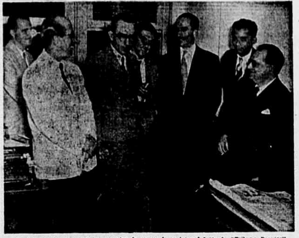
Graciliano Ramos, o terceiro a contar da esquerda, entre redatores da "Tribuna Popular"

As poucas palavras reveladas a gloriosa história da Força Expedicionária Brasileira que derramou seu sangue para apressar o esmagamento do nazismo no mundo. Seus heróis receberam do nosso povo a maior demonstração de massa que jamais se registou nas ruas do Rio de Janeiro, quando um milhão de pessoas saiu ás ruas para abraçar os bravos que regressavam. Não poderia haver melhor maneira de revelar-se a gratidão popular pelo que eles fizeram, ao mesmo tempo, a melhor demonstração de que o povo do Brasil é, na sua totalidade, anti-