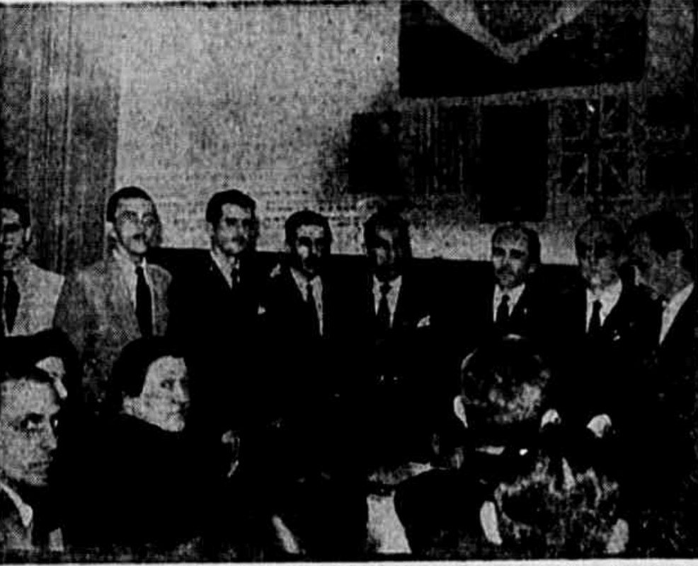
Um aspecto da cerimonia da instalacao do Posto Eleitoral do P.C.B., na rua Colina n.º 64

Instalados a Celula Comunista e o Posto Eleitoral do Comité Metropolitano do P.C.B., no Estácio