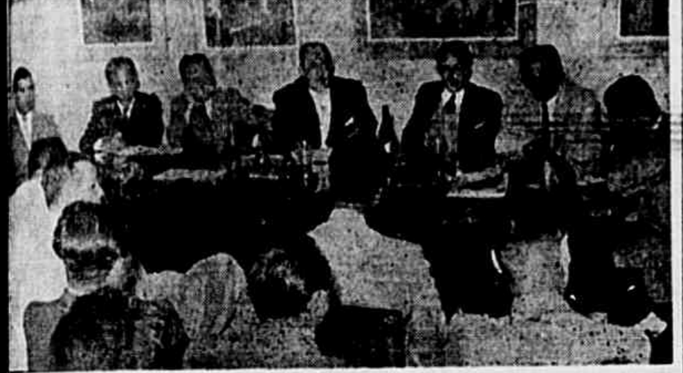
Um aspecto da mesa que dirigi a reunião dos medicos

Os medicos manifestam-se contra a inflama quinta-coluna verde