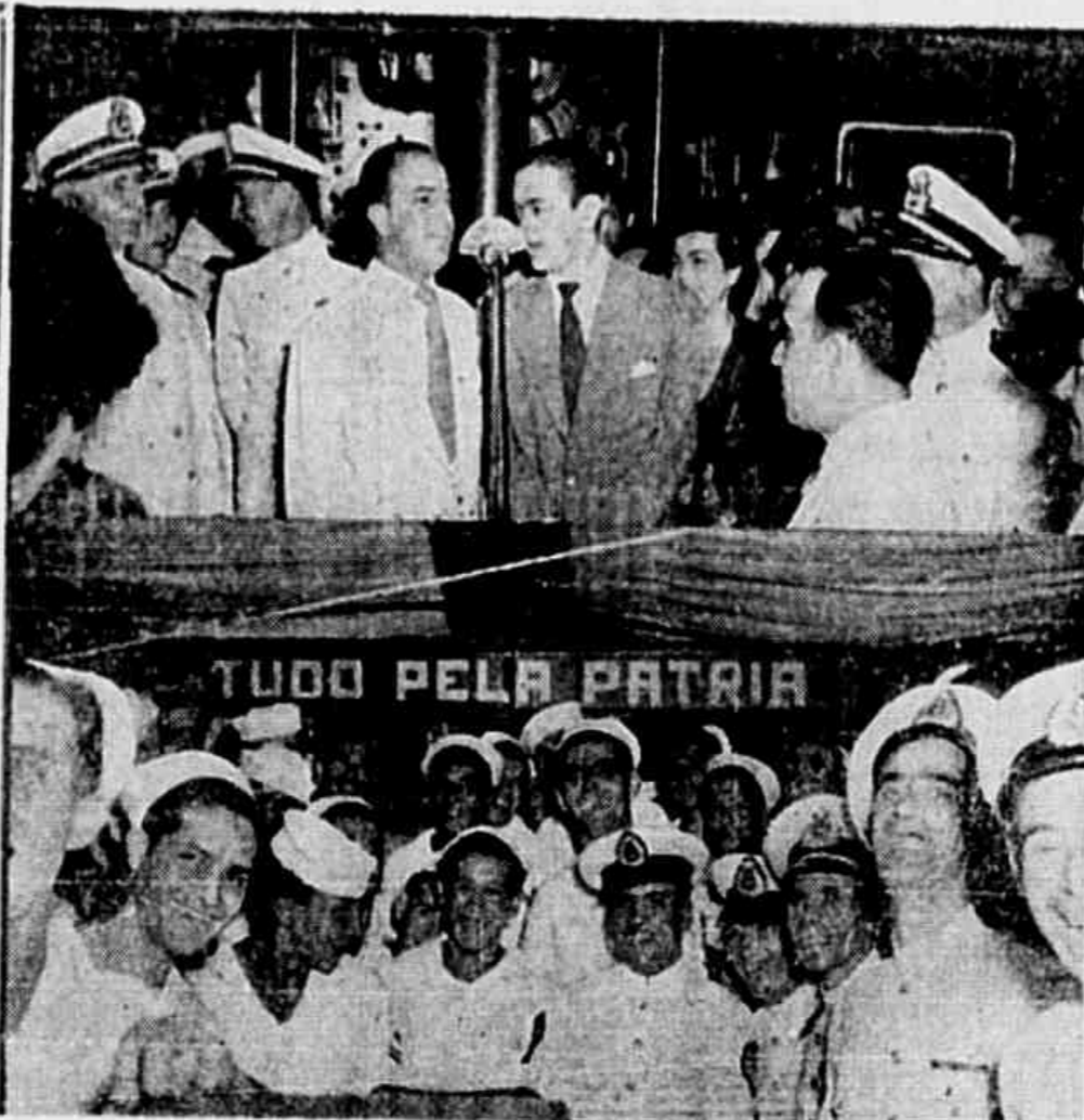
Esta gravura reproduz dois aspectos de uma festa promovida pela Liga da Defesa Nacional, a bordo do "Bahia". No alto aparecem o comandante e o imediato, por trás do locutor que está ao microfone. Em baixo, sub-oficiais sargentos e marinheiros. A legenda "Tudo pela Pátria" fixada sob o toldo, assume, depois da tragédia, um significado mais forte. Realmente estes heróis da Batalha do Atlântico deram tudo pela Pátria.

Como a viagem do general Mascarenhas para o Brasil assumiu o comando interino das tropas que estão aguardando transporte na Itália o general Osvaldo Cordeiro de Farias. Essa força é composta de 20 mil homens