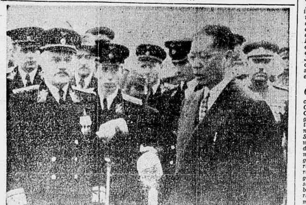
O "PREMIER" CHINES EM MOSCOW — T. Soong, primeiro ministro da China, esperava funcionários soviéticos. (Foto ACME, enviado de seu clichê no ato, quando saíam do povo soviético Moscou para Nova York pelo rádio, e desta capitulação no momento da sua chegada a Moscou. Apreta-lal para o Rio de Janeiro, por via aérea. Especial para o momento da sua chegada a Moscou. Apreta-lal para a R para a "TRIBUNA POPULAR".)

O DIRIGENTE máximo do Partido chinês é Mao Tse-tung. Conclui na 3.ª pág.