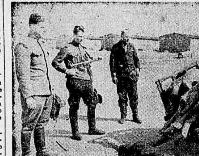
ATROCIDADES ALEMAS — Esta fotografia, tomada pelos fotógrafos soviéticos num campo de concentração de prisioneiros feitos ao Exército Vermelho, perto de Lamedorf, é mais uma amostra das indecifráveis atrocidades praticadas pelos selvagens nazistas. A criança que aparece na fotografia es-

A referida proposta foi alvo de críticas favoráveis e desfavoráveis, tendo falado cerca de 25 trabalhadores externando cada um o seu ponto de vista sobre as condições do aumento em estudo. Outras propostas foram apresentadas adendos à primeira foram sugeridas. Como não se chegasse a um resultado definitivo a mesa que presidiu à assembléia, resolveu, por unanimidade, que o assunto será oportunamente anunciado.