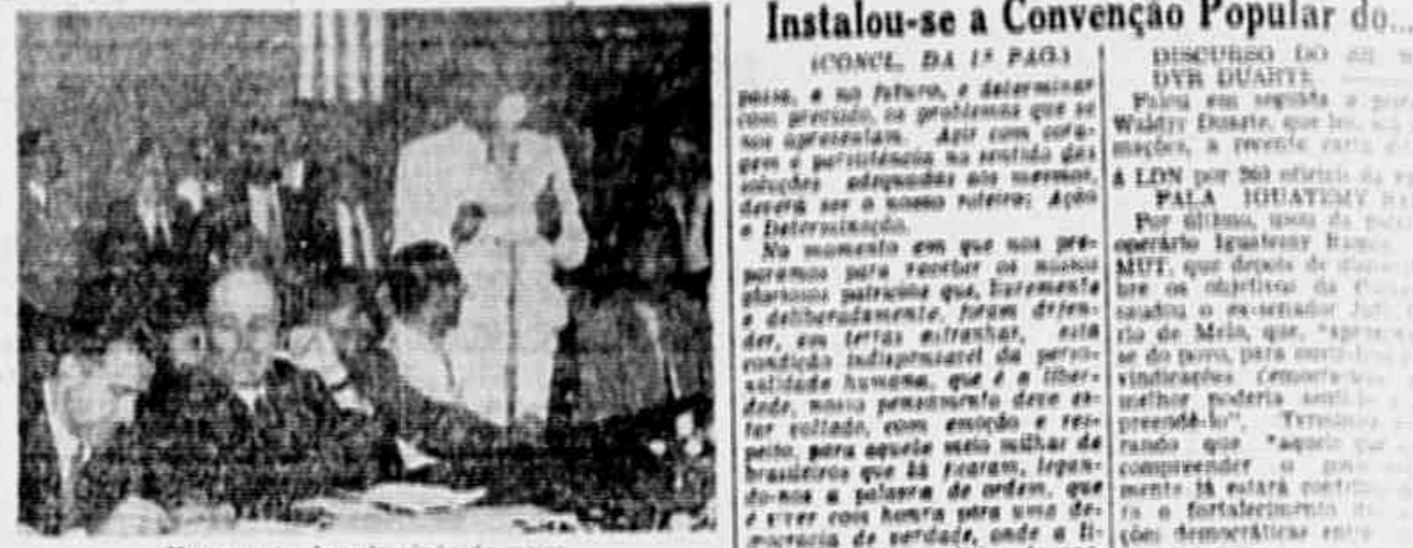
Um aspecto da solenidade da posse.