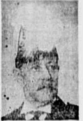
Almirante Greenhalgh Barreto

Trata-se de um documento bastante relevante. O simpatizante Greenhalgh Barreto não é somente um dos grandes nomes da nossa Marinha de Guerra, é também um homem inteligente e culto.