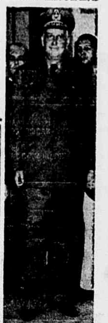
Almirante Ary Parreiras

GUAM, 10 (U. P.) — URGENTE — Informa um comunicado oficial do almirante Nimitz que Toquio está sofrendo, nestes momentos, o maior ataque aéreo da guerra no Pacífico. Acrescenta que o ataque se efetua com surpresa completa dos japoneses.