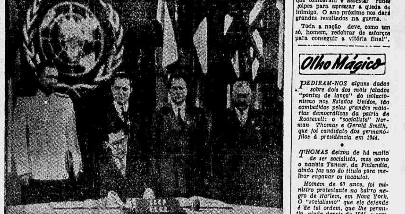
A foto acima mostra o embaixador soviético nos EE. UU., Andrei Gromyko, quando assinava, em nome da sua Pátria, a Carta das Nações Unidas, elaborada na Conferência de São Francisco. À direita do sr. Gromyko, vemos outros membros da delegação soviética —.