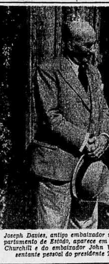
Joseph Davies, antigo embaixador americano em Moscou e atual assistente chefe do Departamento de Estado, aparece em Chequia, na Inglaterra, em companhia do "premier" Churchill e do embaixador John Winant. Davies visitou Churchill na qualidade de representante pessoal do presidente Truman