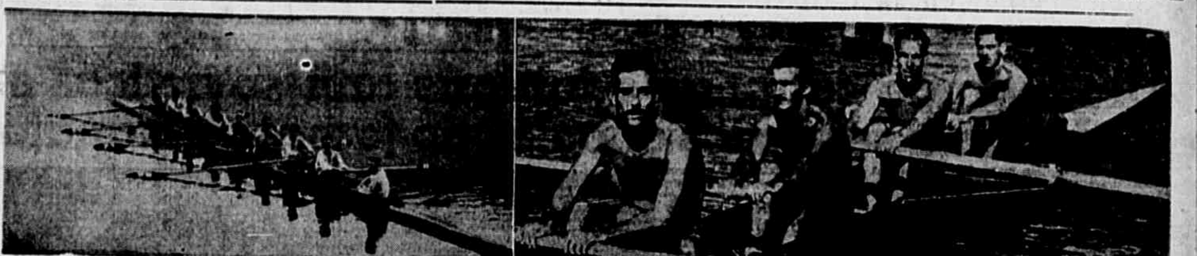
As guarnições de oito e oito dos cariocas e de quatro sem patrão dos baianos. Ambas devem figurar com sucesso no certame aquático de hoje.

Depois de uma vitória difícil sobre o Canto da Ilha, o Vasco voltará esta tarde ao gramado da rua Alvaro Chaves, para defender a sua invencibilidade e a liderança do Torneio Municipal frente ao Botafogo. Trata-se, como se sabe, da partida máxima da rodada. A vitória dos alvi-neros poderá modificar a marcha dos acontecimentos, eis porque a lista vem sendo aguardada com extraordinário interesse pelos torcedores. Prevê-se, aliás, um duelo de características empolgantes, lavando-se em conta o valor das equipes acrecidas ainda a circunstância de sobrevoar o campo que ostentam no momento.