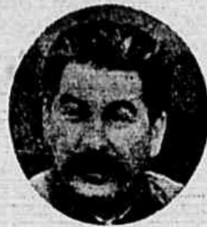
Stalin MOSCÚ, 2 (De Eddy Gilmore, da A. P.) — As grandes potências das Nações Unidas — por sugestão da URSS — têm diante de si um franco desafio no sentido de resolver, por métodos pacíficos, tão rapidamente quanto possível, o conflito no Levante. Com a sua nota, naturalmente.