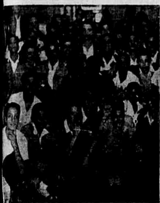
Estudantes dos cursos secundários durante a noite de ontem, em nossa redação

Seu jogo foi escandalosamente descoberto ontem à noite, na assembléa realizada pelos jovens estudantes