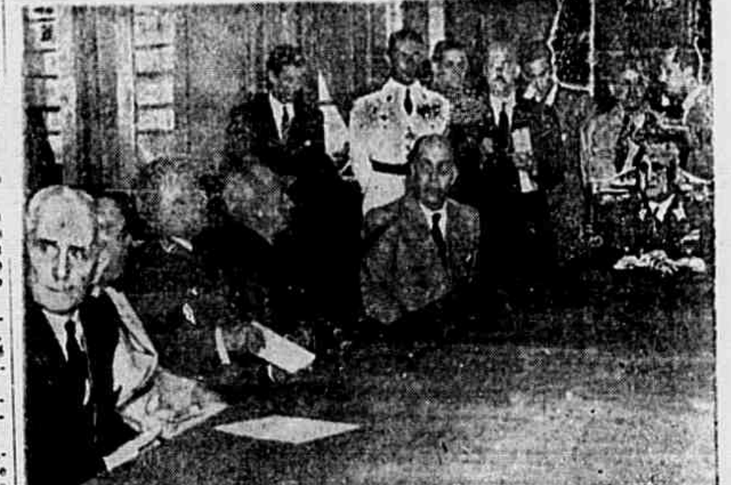
Alas personalidades civis e militares trabalham visando emprestar grandiosidade às homenagens prestadas aos bravos oficiais e soldados da FEB, quando de seu regresso da Itália.