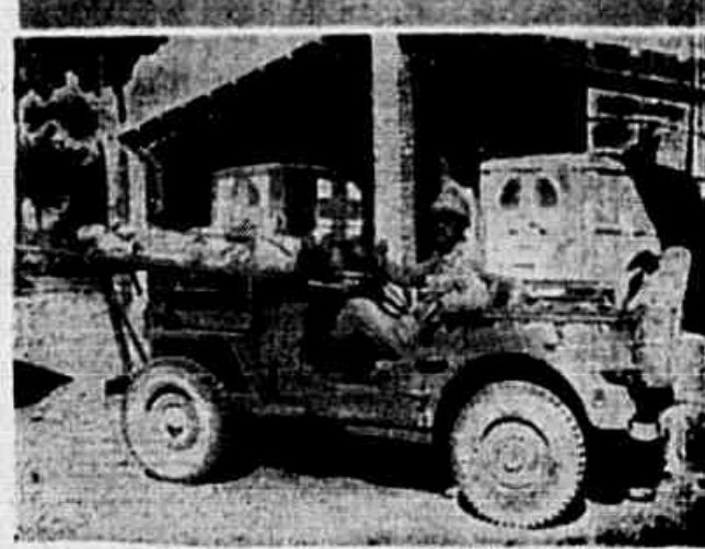
O tenente Bicalho num "jeep-ambulância". No alto o mesmo oficial com jardamento de inverno