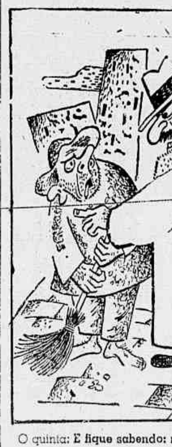
O quinto: E fique sabendo: no século XX aconteceu Hitler!

a ordem restaurada, estaremos preparados para iniciar debates tripartites aqui em Londres".