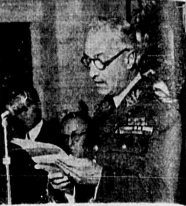
PREPARAM-SE GRANDES HOMENAGENS AOS HERÓIS DA FORÇA EXPEDICIONÁRIA — O general José Pessoa, na presidência do Clube Militar, vem desenvolvendo intensa e patriótica atividade na organização do programa comemorativo da chegada dos bravos expedicionários. (Reportagem na 8.ª página)

Os residentes da Usina da Tijuca estão reivindicando uma feira livre para seu bairro. Alegam os interessados a existência ali de numerosas grandes indústrias, como a Companhia de Cigarros Souza Cruz, a Fundação Americana, a Fábrica de Tecidos Maracanã, vários laboratórios, além do comércio local. Fomos informados ainda que, no mês passado, havia sido enviado um abaixo-assinado pelos moradores da Usina da Tijuca ao prefeito, visando aquela reivindicação, mas até o presente momento nenhuma providência se tomou nesse sentido. Levando-se em conta que ali existem numerosas famílias proletárias, que não dispõem de tempo para efetuar suas compras em mercados distantes, e ainda mais que a feira livre barateia bastante o gênero, esta medida deve ser logo tomada.