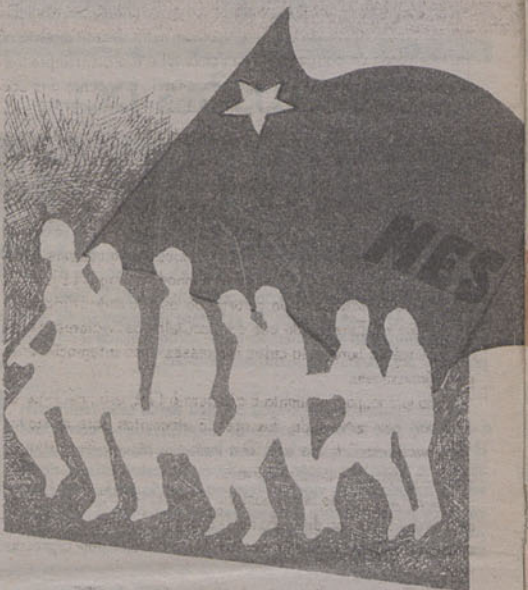
Julho, uma posição devidamente fundamentada sobre estas questões.

5) O MES tomará pública, após a realização da próxima reunião do seu Comité Central, em Lisboa, nos dias 22 e 23 de