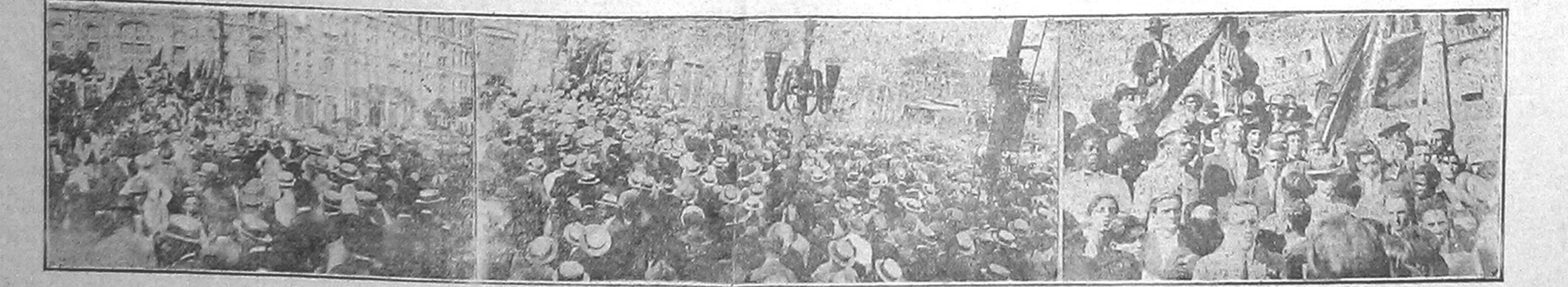
Estampamos aqui alguns flagrantes do comício-monstro realizado pela Federação Syndical Regional do Rio na Praça Mauá, a 1.º de Maio.