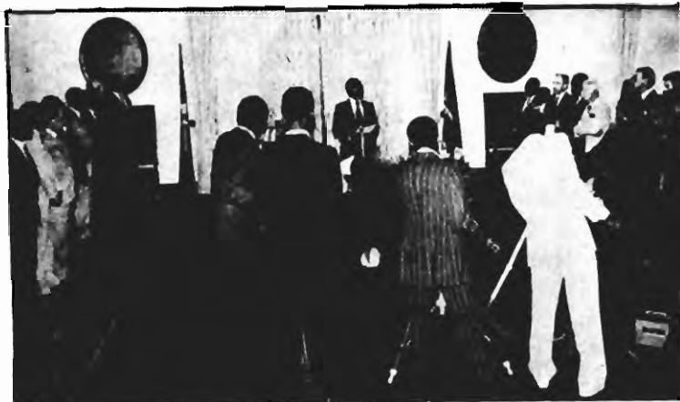
«Em 1988 aprofundaremos e ampliaremos as acções de controlo sobre as empresas, cooperativas e unidades de produção, e sobre o próprio aparelho de Estado» — Presidente Samora Machel

Respeitando a nossa opção socialista, promovemos a cooperação com todos os membros da comunidade internacional. Com optimismo realista encaramos o desenvolvimento positivo das relações que mantemos com novos parceiros económicos.