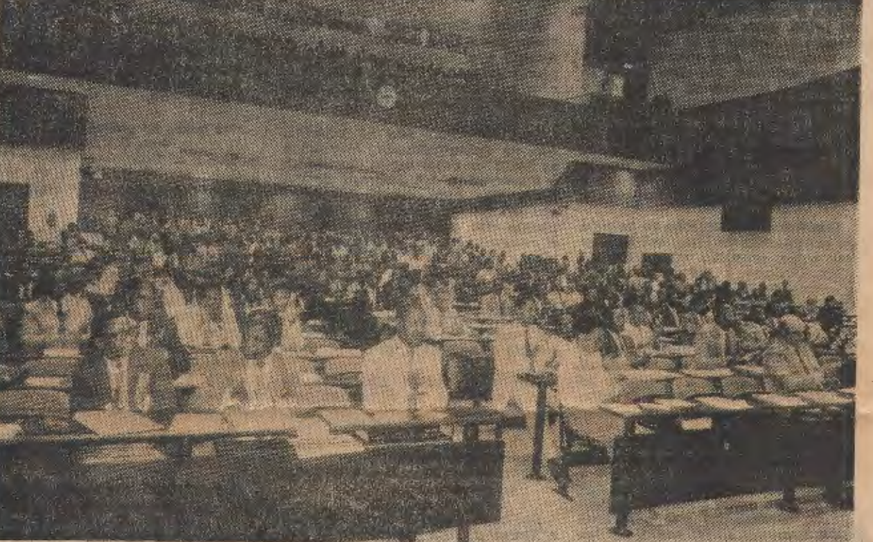
Na sessão plenária, ontem de manhã, várias intervenções mereceram aplauso dos deputados. As palavras do Presidente Samora Machel foram propostas ficar como documento de estado

É verdade! Temos lutado contra estas atitudes e contra os preconceitos que eles geram, mas continuamos ainda a ser vítimas da sua influência. Ainda não assumimos a grandeza do nosso País e a capacidade que já demonstramos em vencer as maiores dificuldades.