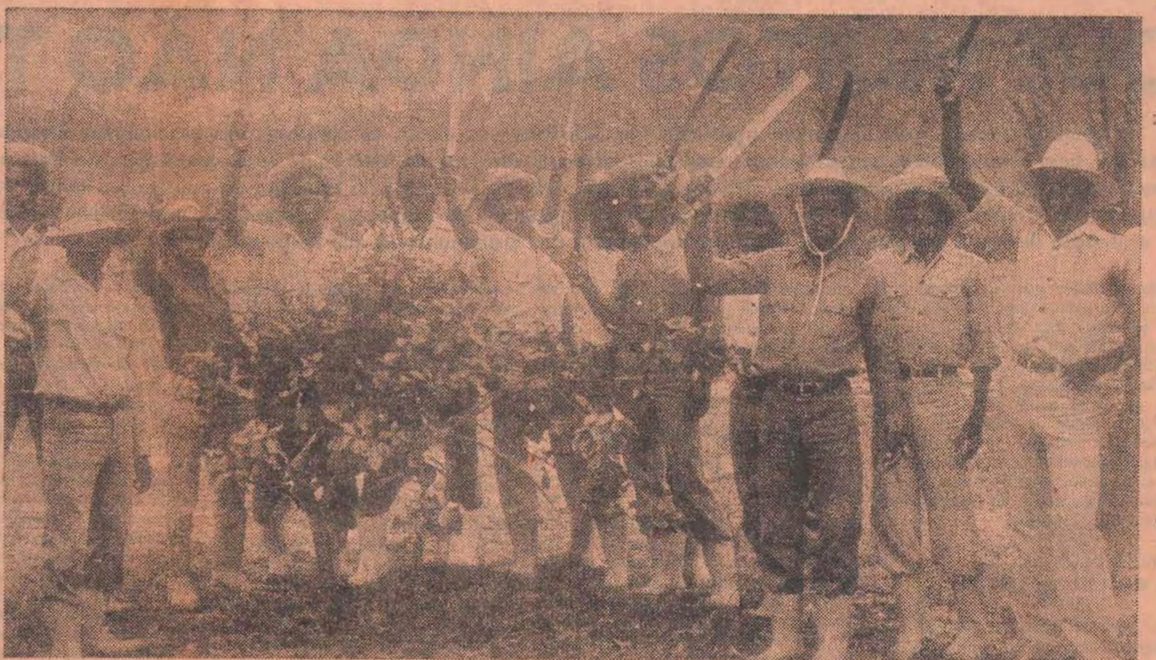
«Na escola vocês vão à machamba. Assim começam a criar a vida». Para aprender a trabalhar, um grupo de estudantes moçambicanos na Ilha da Juventude em Cuba, depois de mais uma jornada de trabalho na machamba anexa à escola