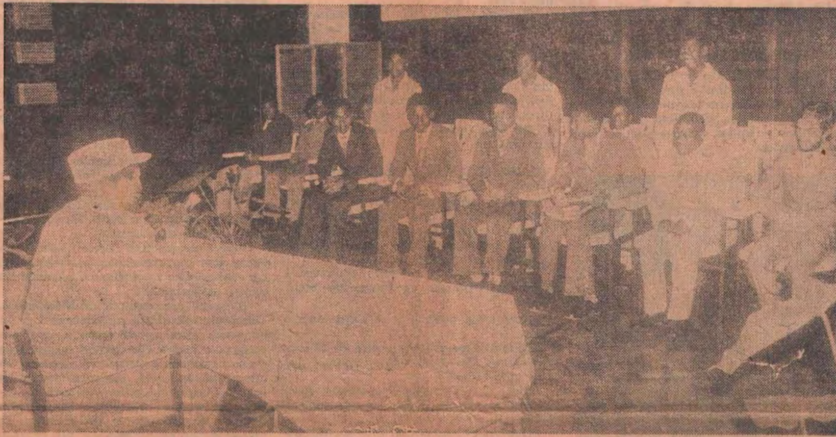
«A vossa tarefa não é só de estudar. Vocês devem debater os vossos problemas para não serem medíocres. Devem, porque estão ao serviço do Povo, aprender como comunicar». A foto foi obtida durante o encontro do Chefe de Estado com aquele grupo de jovens

Os franceses não dizem a palavra «efectivamente», dizem «en effet». Os que estudaram em França muitos anos é raro dizerem