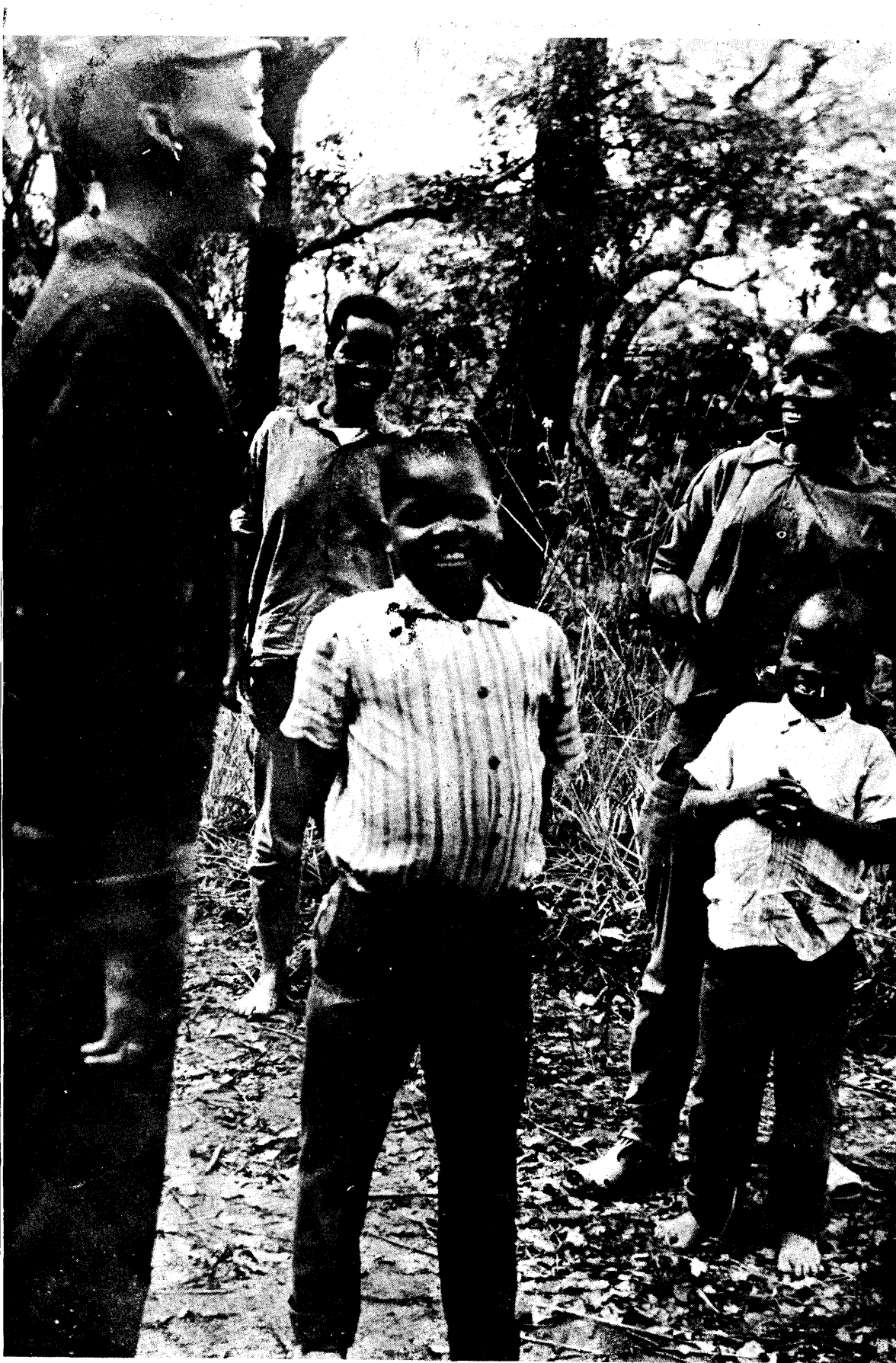
As crianças foram uma das grandes preocupações da Camarada Josina Machel. Seguindo o seu exemplo todá a mulher militante deve fazer as seguintes perguntas: Como descolonizar os nossos filhos? Como libertar a iniciativa das crianças? Como ser mãe e militante?

estudar como fazer e organizar o mesmo programa. Mas para organizarmos é preciso que haja uma idéia comum para que assim possa permitir nascer um plano. Nós compreendemos muito bem as dificuldades que as camaradas têm na realização de certas actividades por causa das crianças. Nós também sabemos que as camaradas têm vontade de trabalhar, mas que não o podem fazer porque as circunstâncias em que se encontram às vezes não facilitam, e por nós estarmos a par disso, dirigimo-nos às camaradas para estudarmos em conjunto o plano, e daí começar o trabalho.