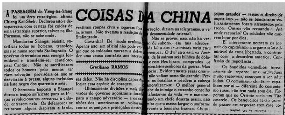
Figura 2 – Crônica “Coisas da China”, estampada no periódico do PCB Voz Operária , em 16 de junho de 1949.

chinesa 18 . Em vista disso, o texto “Coisas da China”, o segundo a compor a coletânea ora apresentada, foi estampado no jornal esquerdista Voz Operária em 16 de junho de 1949. Nesse momento, tal folha passava a ser o órgão central do PCB em substituição à Classe Operária , periódico suspenso e depois fechado pelas forças policiais em maio de 1949.