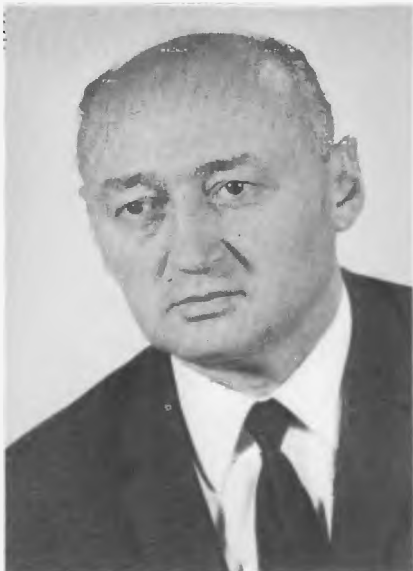
BISZKU BÉLA, a Központi Bizottság titkára