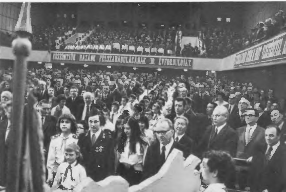
Úttörők köszöntik a kongresszust