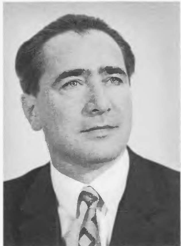
ÓVÁRI MIKLÓS, a Központi Bizottság titkára