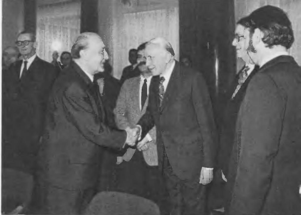
Kádár János tudományos és kulturális életünk képviselőivel