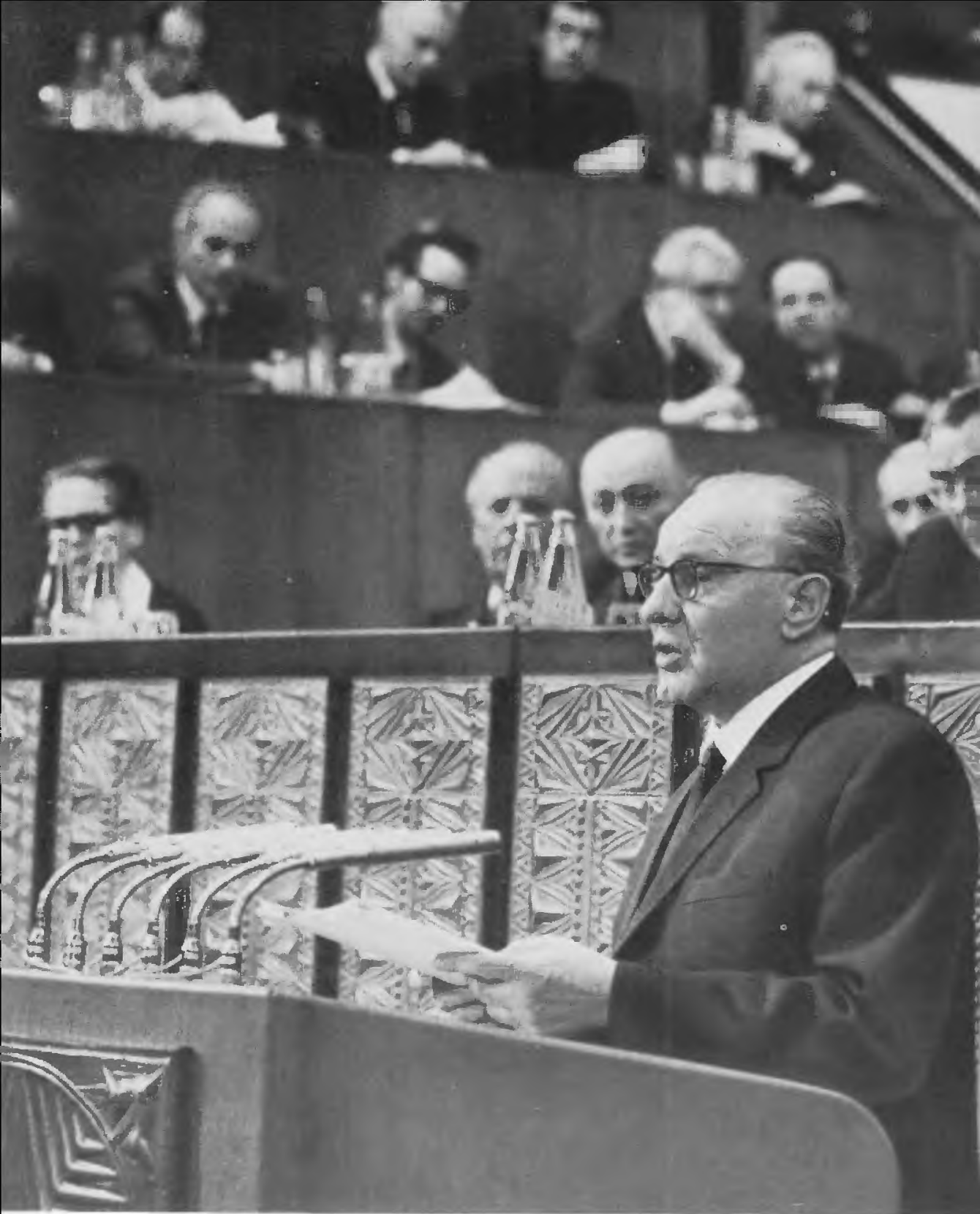
Kádár János ismerteti a Központi Bizottság beszámolóját