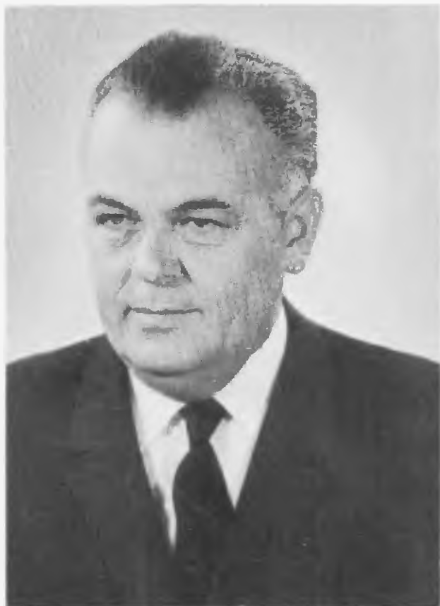
NÉMETH KÁROLY, a Központi Bizottság titkára