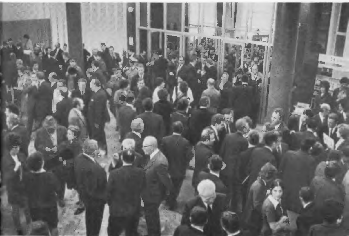
A kongresszus szünetében