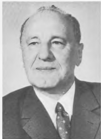
KÁDÁR JÁNOS, a Központi Bizottság első titkára