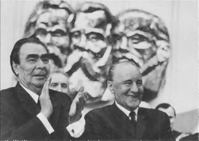
Leonyid Brezsnyev és Kádár János az elnökségben