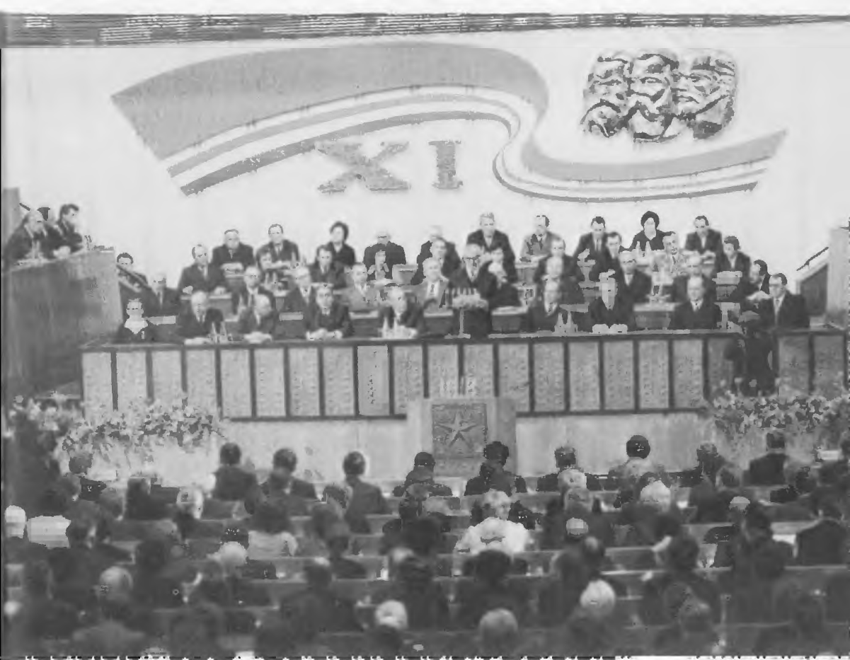
A kongresszus megnyitása