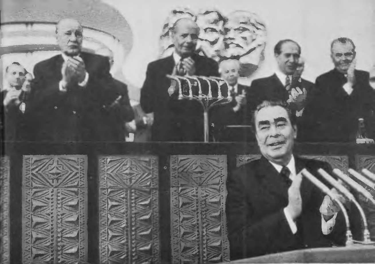
L. I. Brezsnyev, a Szovjetunió Kommunista Pártjának főtitkára üdvözli a kongresszust