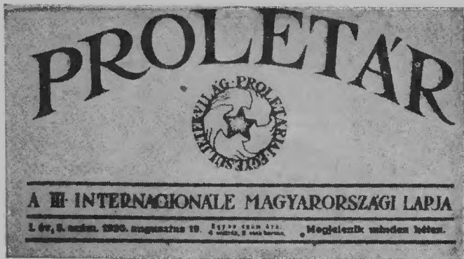
A „Proletár”-nak, a KMP Bécsben megjelent, Magyarországon illegálisan terjesztett lapjának a fejléce. 1920—1922