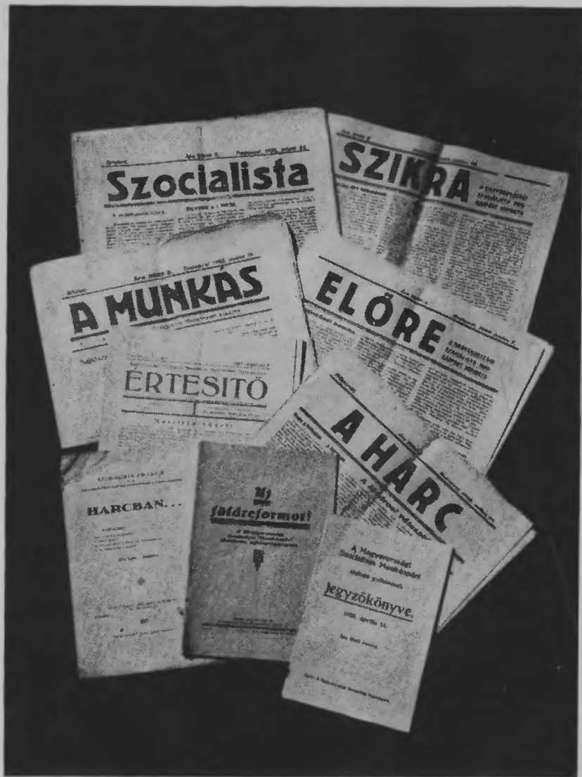
A Magyarországi Szocialista Munkáspárt lapjai és kiadványai. 1925—1926