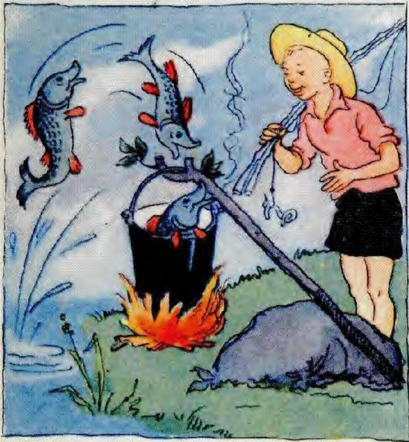
Шелекке балықтың өзі келіп түссе екен.