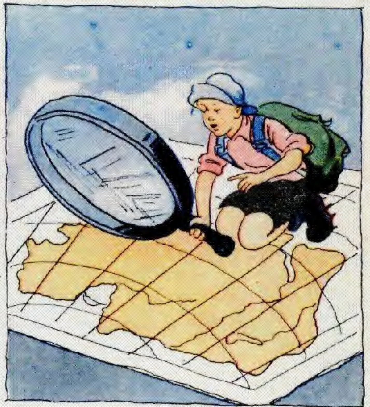
Туған өлкені ол осылай зерттемек.