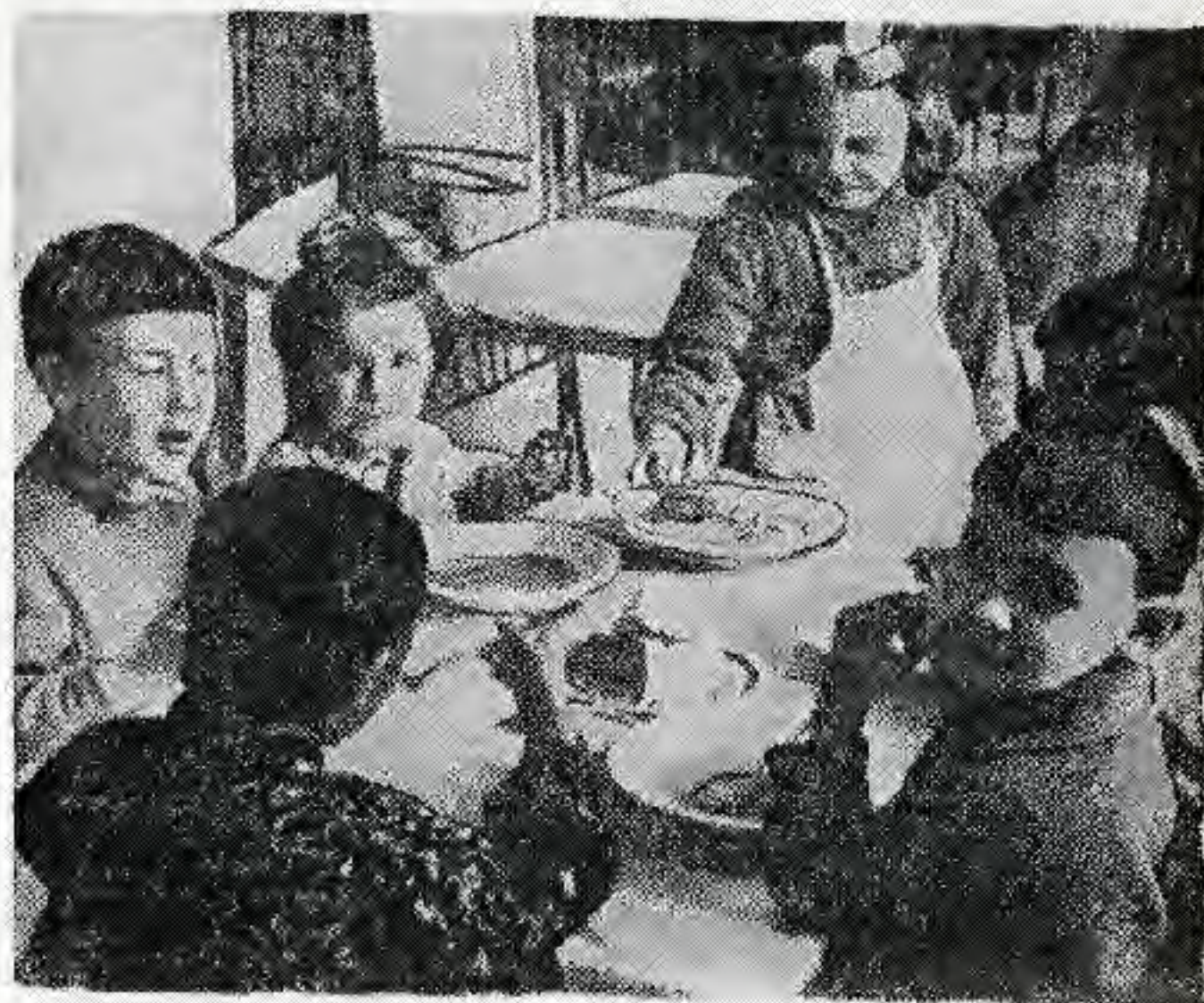
Кезекші Тая тамақ тасып жүр.

ды. Совет ата-аналарын да, олардың көзінің нұры балаларын да осындай алаңсыз өмірге жеткізіп, тәрбиелеп, мәпелеп отырған Советтік Отанға, туысқан Коммунистік партияға шын көңілімен алғыс жаудырады. Шынында да, бұл алаңсыз өмір тек қана біздің еліміз