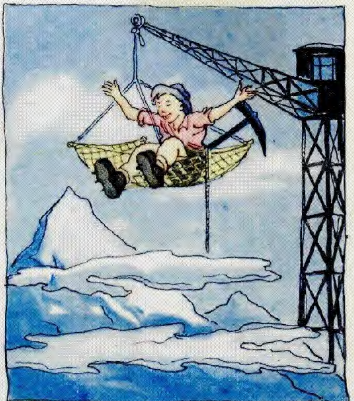
Шыңға осылай шығандамақ.