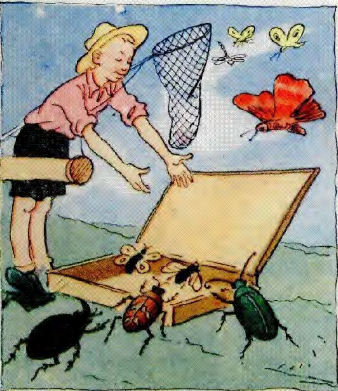
Дәптерге жәндіктердің өзі келіп жабысса екен.