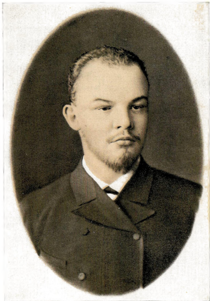
В. И. ЛЕНИН 1890—1891