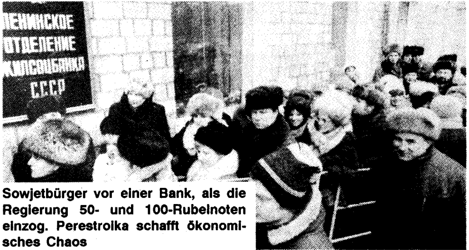
Sowjetbürger vor einer Bank, als die Regierung 50- und 100-Rubelnoten einzog. Perestroika schafft ökonomisches Chaos

Gorbatschows gegenwärtige Wende ist nicht einfach eine Reaktion auf die Provokationen der baltischen Sezessionisten. Sie ist auch eine Antwort auf die Kampagne der „demokratischen“ Opposition, die jetzt von Boris Jelzin von seiner Machtbasis aus als Präsident der Russischen Republik geführt wird. Jelzin drohte damit, eine eigene Währung herauszugeben und eigene Streitkräfte der Russischen Republik aufzustellen. Nach dem Muster einer ökonomischen Kommission des Weltbank-Kartells (Internationaler Währungsfonds, Weltbank usw.), das der Sowjetunion eine „Schockbehandlung“ wie in Polen „empfohl“, drohte Jelzin, 90 Prozent des Beitrags