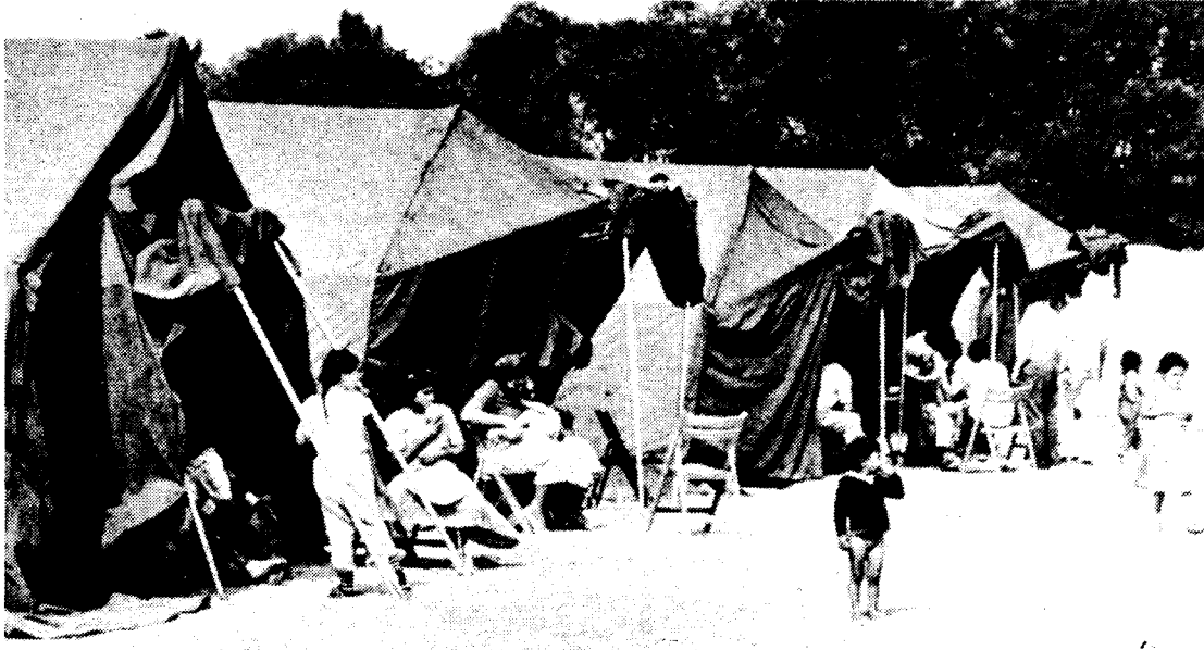
Bundeswehr errichtete Zelte in Hagen für Roma-Flüchtlinge aus Rumänien. SPD-geführte Hexenjagd gegen Roma schürt rassistischen Terror in ganz Deutschland