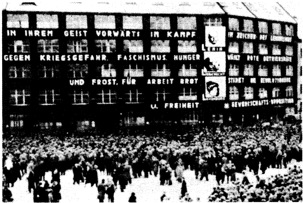
Januar 1932: Hitlers SA marschiert auf das Karl-Liebknecht-Haus in Berlin