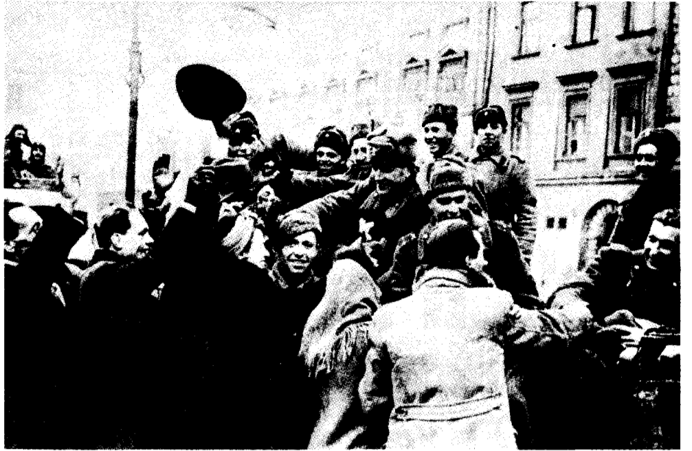
1945: In Krakow einmarschierende sowjetische Truppen werden von der polnischen Bevölkerung als Befreier begrüßt

Die PVAP-Dissidenten bewegen sich jedoch alles in allem gesehen nicht in Richtung auf die Wiederentdeckung des authentischen Leninismus. Sie tendieren eher zu einem liberalen Stalinismus, einem „Sozialismus mit einem menschlichen Gesicht“, wie es der Reformstalinist Dubček während des Prager Frühlings 1968 nannte, und sie versuchen bei den heutigen Führern von Solidarność auf offene Ohren zu stoßen. Darüber hinaus werden Aussprüche von ihnen zitiert, in denen sich antirussische Vorurteile und Meinungen zeigen, wie sie heute in Polen gang und gäbe sind. Ein Delegierter bemerkte auf der Konferenz in Torun: „Unsere sowjetischen Freunde haben eine Geschichte, die sie an den Absolutismus als Regierungsform gewöhnt hat. Aber die Geschichte unserer Na-