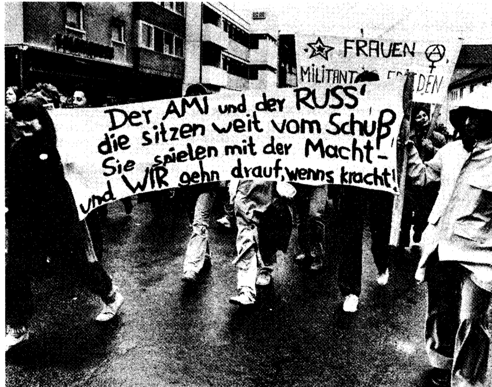
Pazifismus und Nationalborniertheit entwaffnen die Arbeiterklasse, nicht die Bourgeoisie