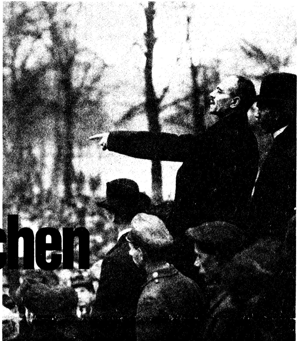
Karl Liebknecht: „Der Hauptfeind steht im eigenen Land!“

Der wütende Antisowjetismus von Reagan und Haig hat die Kriegsgefahr verstärkt. Nicht mehr „Entspannungspolitik“, sondern „Sicherheitspolitik“ heißt die neue Losung. Die von Bundeskanzler Schmidt im Zuge der SALT-Verhandlungen „entdeckte“ Raketenlücke in Westeuropa soll nach dem Willen der NATO durch die Schaffung einer nuklearen „Erstschlagkapazität“ gegen die Sowjetunion „gestopft“ werden, und zwar soll der Löwenanteil der Raketenaufrüstung in Westdeutschland installiert werden, also gleich auf dem Boden des voraussichtlichen atomaren Schlachtfeldes. Der stern schätzt die Zahl der nuklearen Sprengkörper in Westdeutschland auf fünf- bis zehntausend – und dazu sollen die Pershing-II-Raketen mit ihrer Reichweite von 2500 Kilometern und die Marschflugkörper Cruise missile kommen. Westdeutschland ist längst schon „das Gebiet mit der größten Atomwaffendichte auf Erden“ ( stern , „Atom-Rampe Deutschland“, 19. Februar).