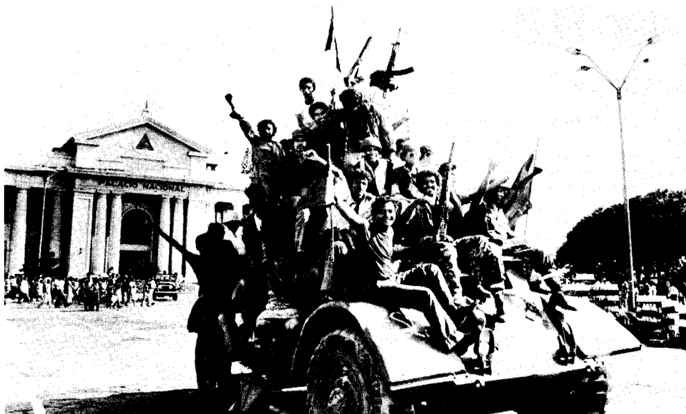
Managua, 19. Juli 1979: Jubel nach dem Sturz des blutigen Schlächters Somoza

Also werden sie im Interesse von „nationaler Einheit“ und „Patria“ nicht die Fabriken und Haciendas enteignen und sie den Arbeitern Fortgesetzt auf Seite 8