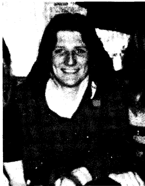
Getötet im H-Block: Bobby Sands

Aber der Rückzug der Imperialisten ist nur die wesentliche Vorbedingung für eine Lösung, noch nicht die Lösung selbst. Die nationale/kommunale Verflechtung in Irland ruft die blutigen Kämpfe zwischen Hindus und Moslems in Indien nach Erlangung der Unabhängigkeit ins Gedächtnis. In den letzten Wochen haben die protestantischen Loyalisten verstärkt mit Angriffen auf die katholische Bevölkerung gedroht. Ian Paisley versammelte 500 seiner Unterstützer, die eine Waffenlizenz besitzen, in North Antrim und am 4. Mai fand eine bewaffnete Versammlung von Mitgliedern der Ulster Defence Association in der Shankill Road in Belfast statt. Ihr Ziel ist eindeutig: sie wollen mit der Waffe in der Hand die Versuche der IRA verhindern, sie in ein vereinigtes Irland einzugliedern. Und unter den gegebenen Umständen könnte auch jeder, der einen solchen Versuch unternimmt, leicht gegen diese