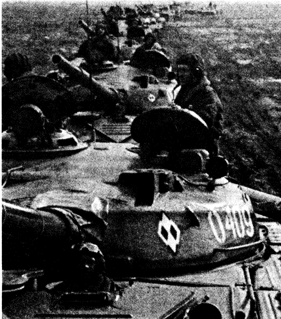
Panzer des Warschauer Pakts in Polen

Selbst wenn der Krenl nicht intervenieren sollte, haben die USA durch ihre endlosen Tiraden über die „Invasion durch Osmose“, „unbegrenzte Ausdehnung der Kriegsmanöver des Warschauer Pakts“ usw. Polen schon längst zum Brennpunkt des Kalten Krieges gemacht. Die USA „scheinen mit einer ganzen Nation eine Art Spiel zu treiben“ ereiferte sich ein Pole aufgebracht über die andauernden Alarmmeldungen aus Washington ( New York Times , 6. April). Reagan und Haig haben allerdings keinen Zweifel daran gelassen, daß sie eine großangelegte russische Intervention wünschen , und sie bemühen sich nach Kräften, den Anstoß dazu zu geben. Sie wollen polnische Arbeiter dazu bringen, unter dem polnischen Adler und dem Kreuz Jesu Molotow-Cocktails gegen