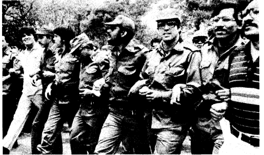
Sandinista-Führer marschieren auf dem utopischen und selbstmörderischen „Dritten Weg“