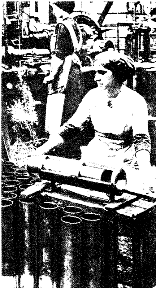
Munitions- arbei- terinnen im Ersten Weltkrieg

Im Laufe des Jahres 1916 kamen die meisten Führer der Linken, einschließlich des siebzigjährigen Franz Mehring, wegen diverser Anklagen ins Gefängnis. Im gleichen Jahr wurde Liebknecht wegen Disziplinbruchs aus der Reichstagsfraktion ausgeschlossen, weil er gegen Kriegskredite gestimmt hatte; Zietz wurde aus dem Parteivorstand ausgeschlossen; Zetkin wurde gezwungen, von ihrem Posten als Herausgeberin der Gleichheit zurückzutreten. Letzteres war ein enormer Sieg für den rechten Flügel, der jahrelang vergeblich versucht hatte, dieses mächtige Sprachrohr der