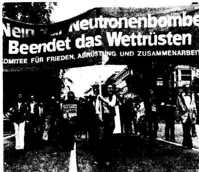
Stalinisten wollen imperialistisches Militär reformieren

So behauptet der belgische General Robert Close, in der BRD von Kalten Kriegern wie dem CDU-Wehrexperthen Wörner unterstützt, in seinem kürzlich erschienenen Buch Europa ohne Verteidigung , daß russische Truppen bei einem konventionellen Angriff des Warschauer Pakts inner-