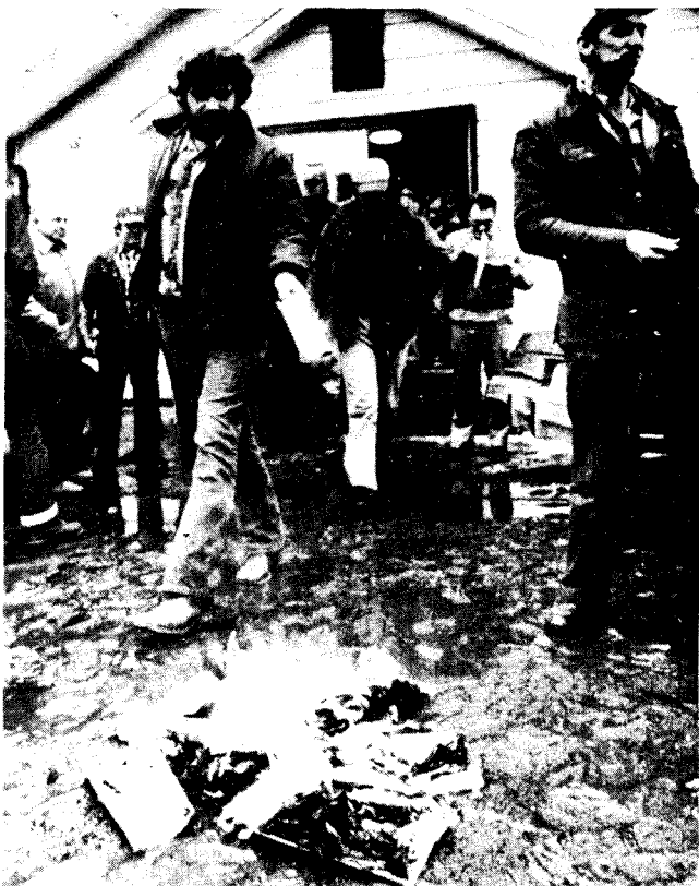
Bergarbeiter verbrennen Tarifvertragsentwurf