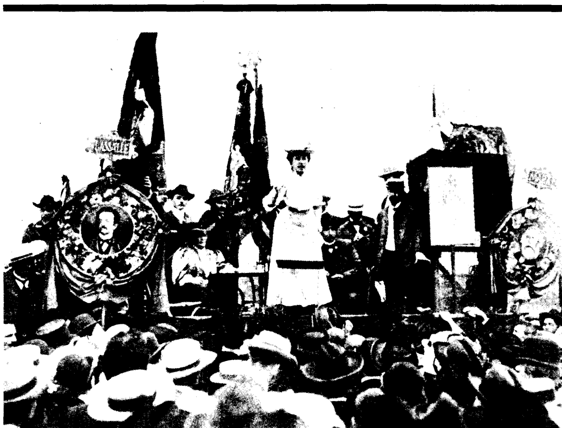
Rosa Luxemburg, flankiert von Portraits von Marx und Lassalle, spricht auf einer SPD-Kundgebung, 1907

In dieser Periode der relativen Prosperität und des Klassenfriedens in Deutschland konzentrierte sich die Auseinandersetzung in der Partei auf Bernsteins revisionistische