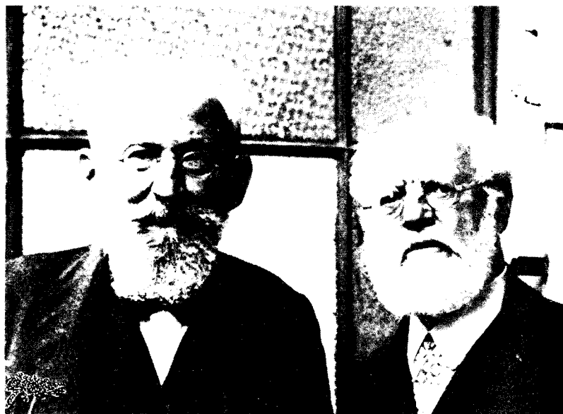
Eduard Bernstein und Karl Kautsky

Theorie der friedlichen Entwicklung zum Sozialismus. Nach seinem Bruch mit der materialistischen Geschichtsauffassung betrachtete Bernstein den demokratischen kapitalistischen Staat nicht als Organ zur Unterdrückung des Proletariats, der zerschlagen werden muß, sondern als ein Instrument, dessen man sich bemächtigen und das man zur Verwirklichung des Sozialismus benutzen muß. Weil nach dieser Theorie Angehörige aller Klassen gleichermaßen für fähig gehalten wurden, höhere sittliche Instinkte für das Ziel des Sozialismus zu entwickeln, verschwand die Notwendigkeit für die besondere Organisation der Arbeiterklasse. Für Bernstein bedeutete die Revolution nur die Unterbrechung des aufblühenden, demokratischen Kapitalismus, der, bliebe er ungestört, die geeigneten Bedingungen für den Fortschritt der Menschen schaffen würde. Obwohl die Bernsteinschen Ideen auf den Parteitag 1899 und 1901 niedergestimmt wurden, gab es eine Tendenz innerhalb der Partei, die das theoretische Gerüst Bernsteins weiterhin unterstützte. Rosa Luxemburg, Clara Zetkin und Karl Liebknecht standen an der Spitze des Kampfes gegen die Revisionisten und wurden in diesem Punkt von den wichtigsten Führern der Partei, sogar den Mitgliedern der Reichstagsfraktion, unterstützt.