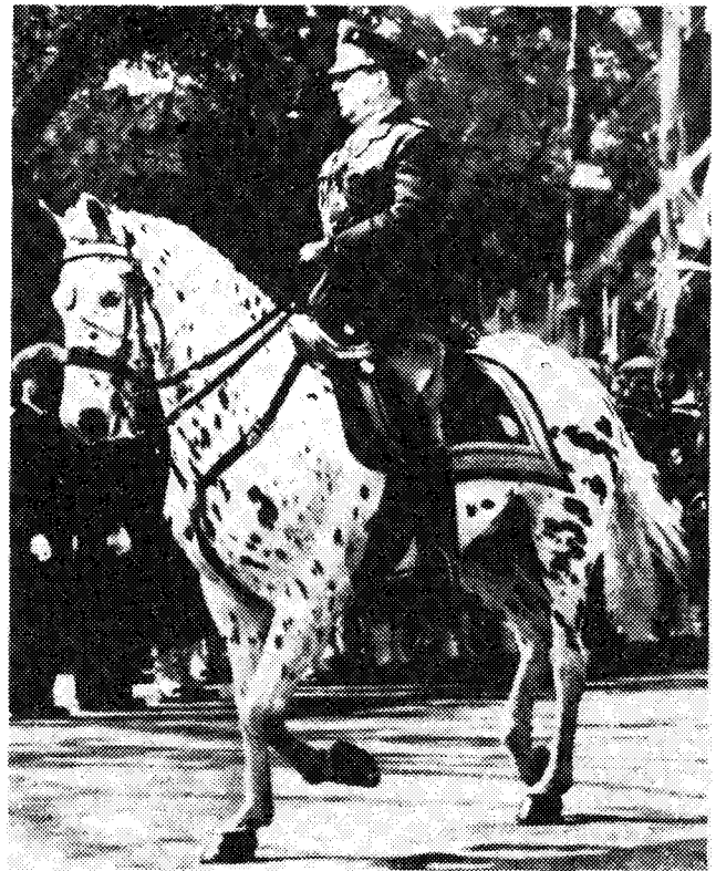
Juan Domingo Perón.

Der Hinauswurf von Frau Peróns Rasputin wurde allgemein als Sieg für die argentinischen Arbeiter angesehen. Weit bedeutsamer jedoch war der Bruch, der sich zwischen der Arbeiterbewegung und den führenden Köpfen der peronistischen