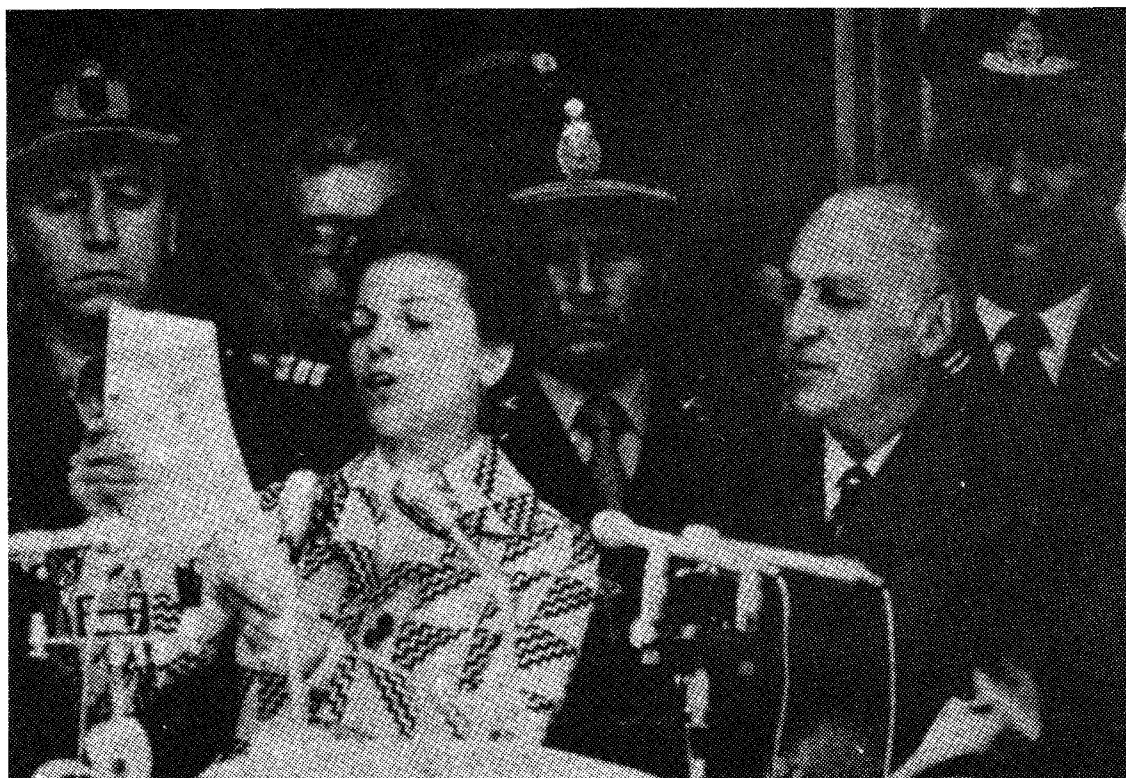
Isabel Perón mit López Rega und Generälen.

nanzmittel verbraucht und der „Wohltäter“ zerschlug die Streiks von CGT-Gewerkschaften. Und als er 1973 zurückkehrte, tat er das mit einem Programm, das auf der ganzen Linie reaktionär war. Seine Aufgabe: die Militanz der Arbeiterklasse, die die Armee nach den Córdoba-Unruhen von 1969 nicht mehr im Zaun halten konnte, zu zerschlagen.