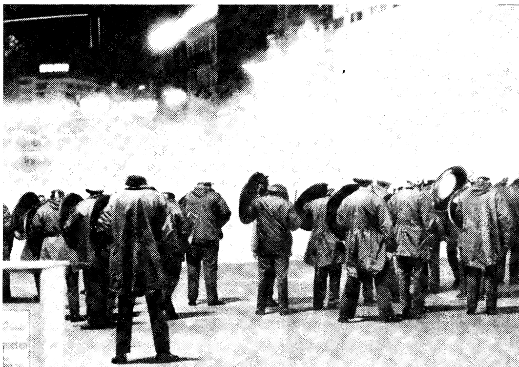
Gaseinsatz gegen RAF-Solidaritäts- aktion in Berlin.

Kontakt untereinander verboten. Volle Meinungsfreiheit – das gibt es nur für die Schergen des bürgerlichen Staatsapparates, für die Lakaien der herrschenden Klasse. Während den Genossen der RAF nicht nur der freie Schriftverkehr, sondern auch jeder mündliche unüberwachte Kontakt untersagt wird (selbst der zu ihren Verteidigern), läßt der bürgerliche Staat die gewählten Verteidiger der Angeklagten ausschalten und versucht, sie zu kriminalisieren. Er durchsucht und raubt Verteidigungsakten. Dem neuen Verteidiger Baaders wurde nicht einmal genügend Zeit zugebilligt, sich in die Anklageakten einzulesen, da „das Interesse Baaders nicht schutzwürdig“ sei! Er erklärt damit offen, was eigentlich erst bewiesen werden sollte: Die „Baader-Meinhof-Bande“ sei eine kriminelle terroristische Vereinigung und Staatsfeind Nummer eins.