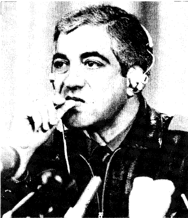
Mal „links“, mal rechts: Bonapartist Carvalho.

Fidel Castros usw., tatsächlich ist er aber das gefährlichste Element aller MFA-Führer. Für einen Moment gibt er sich damit zufrieden, daß die von der SP beeinflussten Offiziere seinen Hauptfeind, Gonçalves, ausschalten in der Absicht, sich ganz von der KP frei zu machen. Aber sobald Antunes und Fabião diskreditiert sein werden, könnte Carvalho als Führer eines rechten Staatsstreichs einspringen und seinen Traum, die Rolle eines Napoleon Bonaparte zu spielen, erfüllen. Die Maoisten trotten ihm blindlings hinterher und stehen in einer Front mit Priestern und Faschisten gegen die KP – unter der Devise, gegen den „sowjetischen Sozialimperialismus“ zu kämpfen; damit bereiten sie nicht nur ihre eigene Zerschlagung, sondern auch die Vernichtung der Blüte des portugiesischen Proletariats vor.