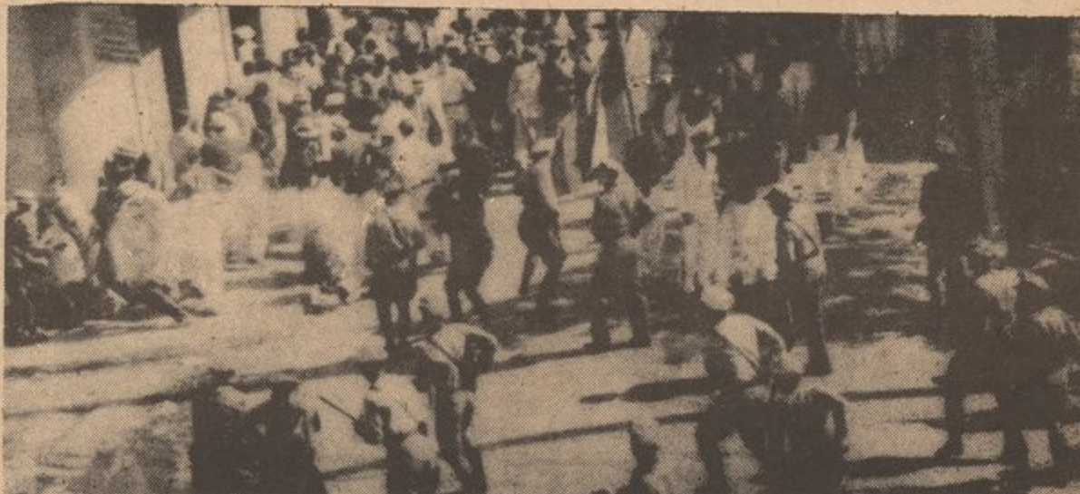
Here we see the colonial police carrying out the orders of the American Govt. to terrorize the Puerto Ricans people's fight for Independence.

The Nationalist Party has always believed that the only way that Puerto Rico will win its Political Econ. Social Independence is by forcing the foreign oppressors out through means of armed struggle.