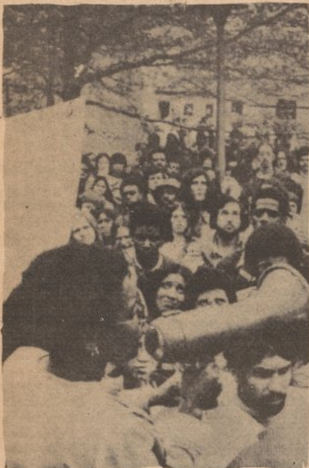
Puerto Rican and Black students denouncing U.S. Imperialism in a student demonstration.

We have also learned that neither American Capitalism, Black capitalism, Puerto Rican capitalism ("the way to move forward is for all Puerto Ricans to support our Puerto Rican businessmen") spiritualism, pacifism, nor cultural nationalism ("all Puerto Ricans are brothers and sisters and we have to stick together or else the Blacks will get everything; We can depend only on ourselves to solve our problems")--none of these can