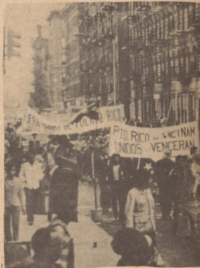
Demonstrations in support of the National Liberation struggles in Viet Nam and Puerto Rico.

We believe that the struggle of Puerto Ricans against discrimination, for democratic rights, and for the liberation of Puerto Rico and all colonies (the best way we can contribute to the liberation of Puerto Rico); the struggle of the entire U.S. working class against the greedy monopoly butchers must be guided by an ideology, Marxism-Leninism Mao Tse Tung thought, and an organization, the multi-national communist party of the United States which we must help form if we are going to be victorious. It is the only way that we can combat the attacks of the imperialists, bring forward and