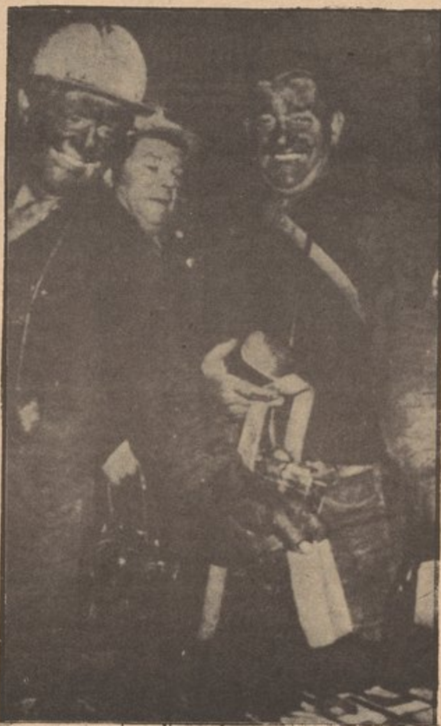
British mine workers cast strike votes after the night shift, (above) while union leaders demonstrate outside London' union hall (right).

En el poco tiempo que la huelga a durado la industria del acero a sentido sus efectos. Hasta la fecha 250,000 obreros en la industria del acero han sido despedidos y la produccion ha declinado de un 77% antes, a un 30% durante la huelga. Sin el carbon el proceso que termina la produccion del