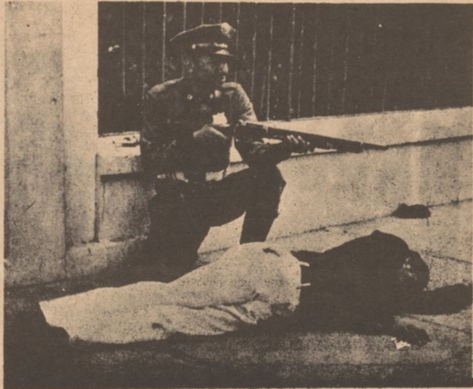
Siguiendo las ordenes del Norte Americano, aqui vemos la policia colonial terrorizando el pueblo Puertorriqueño en su lucha por la Independencia.

Mientras mas crecía el apoyo de la gente en toda la isla por el partido nacionalista, mas representaba una amenaza para el gobierno americano. El asesinato por la policía de cinco líderes nacionalistas en Río Piedras, el 24 de octubre de 1935, provocó el contra-ataque en febrero de 1936, en que fue ejecutado revolucionariamente el Coronel Riggs, jefe de la policía colonial. Las muchas demostraciones contra la persecución federal y en apoyo de los nacionalistas encarcelados, ocurridas en el año del '36, fueron los eventos que culminaron en la Masacre de Ponce.