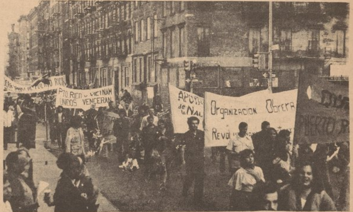
Hundreds of people marched through Manhattan's Lower East Side Sept. 24, chanting, "Free Puerto Rico, Right Now!" The militant, spirited march went from Essex and Delancy streets to the United Nations building, greeted by raised fists and shouts of "Que Viva" all along the way. As the protest grew to about 1500 people at the UN, speakers demanded that the UN General Assembly approve a report by a sub-committee calling for self-determination for Puerto Rico. They also demanded that the U.S. cancel its plans to construct a "superport" for oil tankers on the island, which should make more money for U.S. business at the expense of the Puerto Rican people. The demonstration was sponsored by a united committee of many progressive Puerto Rican organizations in New York.

Mientras los EE.UU. sufre derrota tras derrota, y mientras sus mercados de explotación se estrechan, los imperialistas tratan de echar la carga en las espaldas de la clase obrera dentro de su propio país (y esto incluye a los puertorriqueños dentro de los EE.UU.). Hoy estamos pasando por esa situación: crisis en el imperialismo y aumentos en los ataques al pueblo trabajador dentro de los EE.UU. Estos ataques se manifiestan através de la llamada "crisis de energía," através de la congelación de salarios, através de los aumentos de precios en la comida, la renta, en el crecimiento continuo de las filas de desempleados,