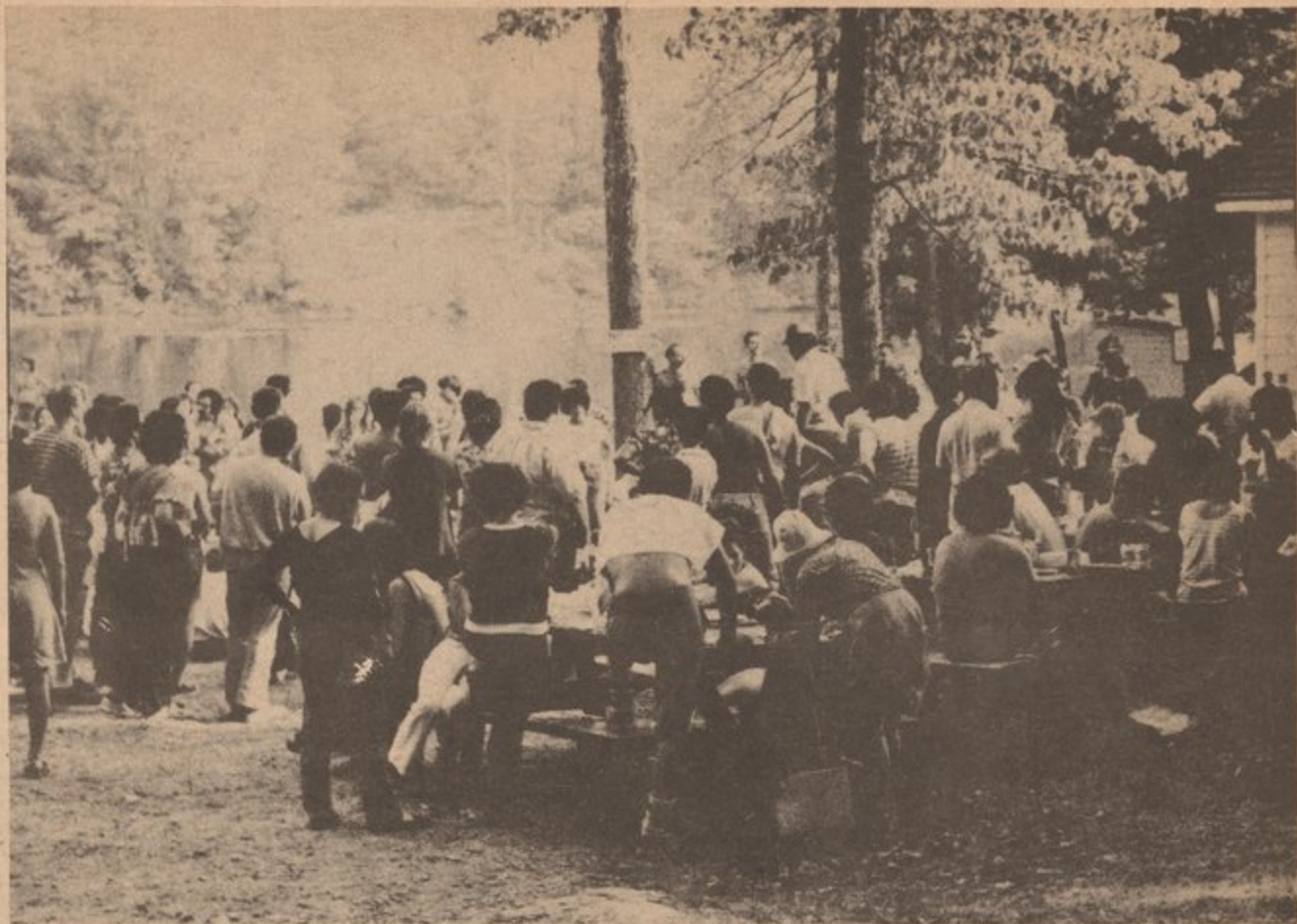
Las guaguas regresaron a la ciudad a las seis de la tarde, pero otros que tenían sus propios medios de transportación se quedaron hasta más tarde.

El personal de Palante da gracias a todos aquellos que asistieron y ayudaron en la gira.