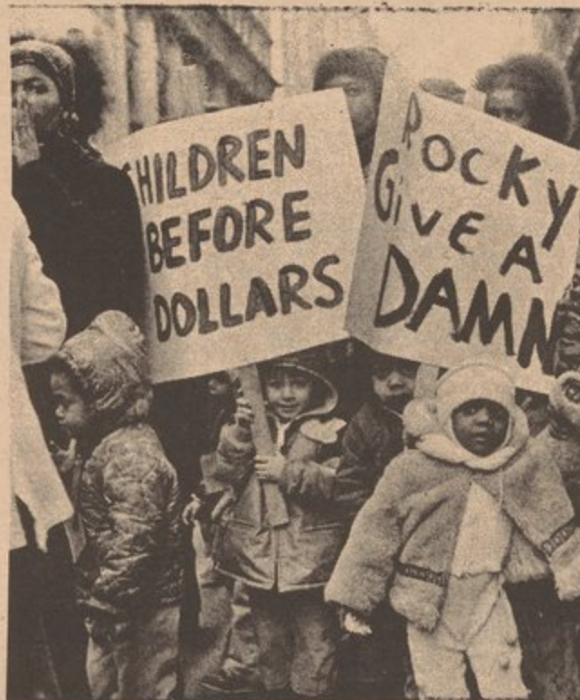
Mothers demonstrate to keep City Day Care open.

The rich bosses get for profit half the salaries of the workers forced into these programs. Already in New York City more than 40,000 people are working in these slave programs. And let's not be fooled by the governments lies that new jobs are being created, because thousands of workers were laid off in order to carry out this program.