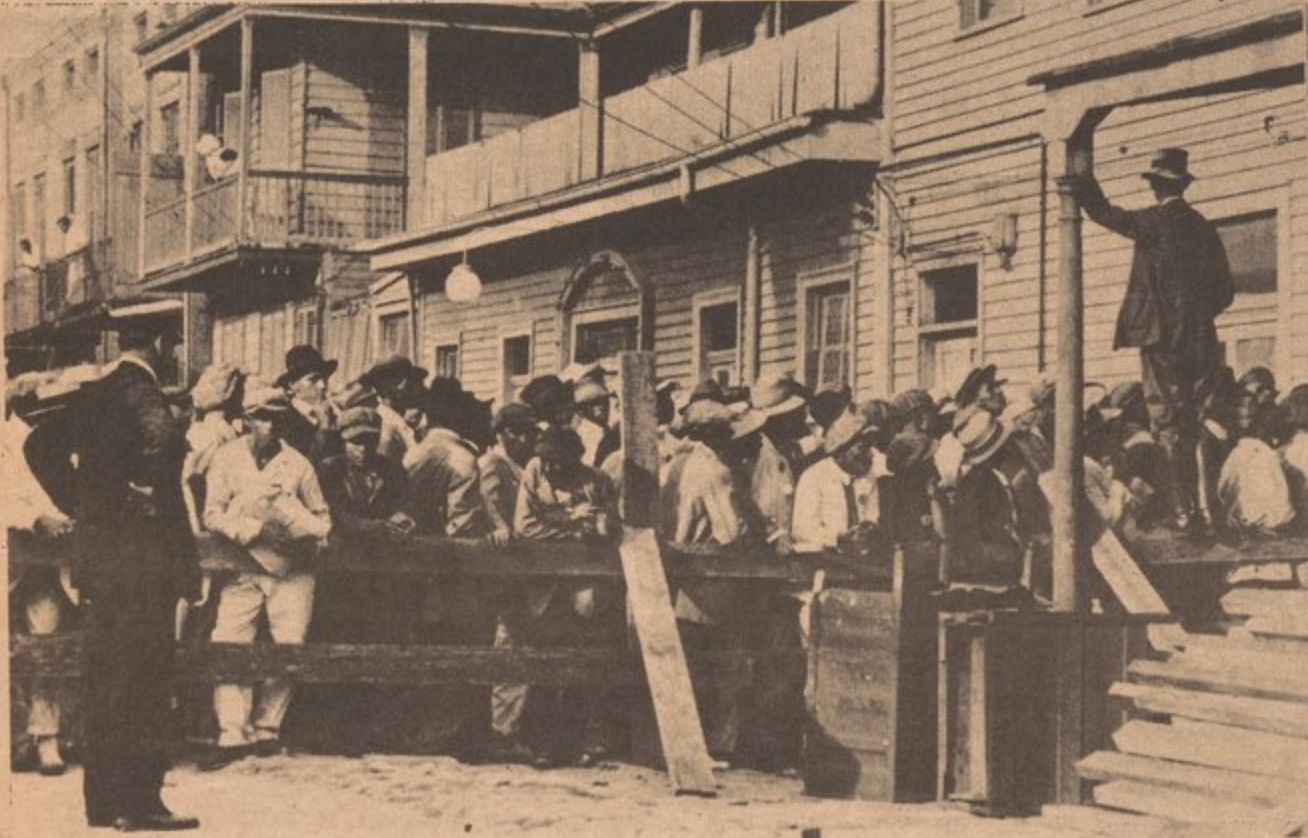
Puertorriqueños en los 30's registrándose para trabajos de construcción en New Orleans.