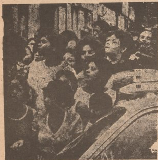
After police arrested suspect in mutilation-murders of 4 little boys, community came to show their concern.