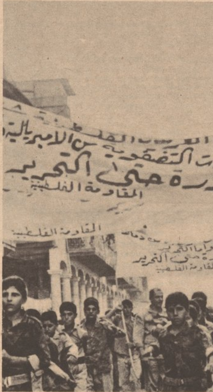
Los guerrilleros Palestinos en Bagdad denuncian ferozmente el imperialismo de E.U. por su intriga criminal al tratar de destruir la lucha armada del pueblo Palestino.

muerdos en menos de dos semanas. Mas, a pesar de todo ello, el rey Hussein fracasó en su intento de liquidar la existencia pública de la Resistencia y desde entonces hasta agosto del '71 los enfrentamientos eran diarios. No fue hasta agosto del '71 que entre las fuerzas del ejército real y la aviación israelí atacaron durante más de una semana, día y noche, las bases de