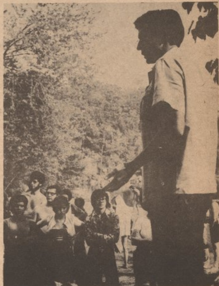
The buses left the picnic site around 6:00, but some of the people who had their own transportation stayed longer.

El personal de Palante da gracias a todos aquellos que asistieron y ayudaron en la gira.