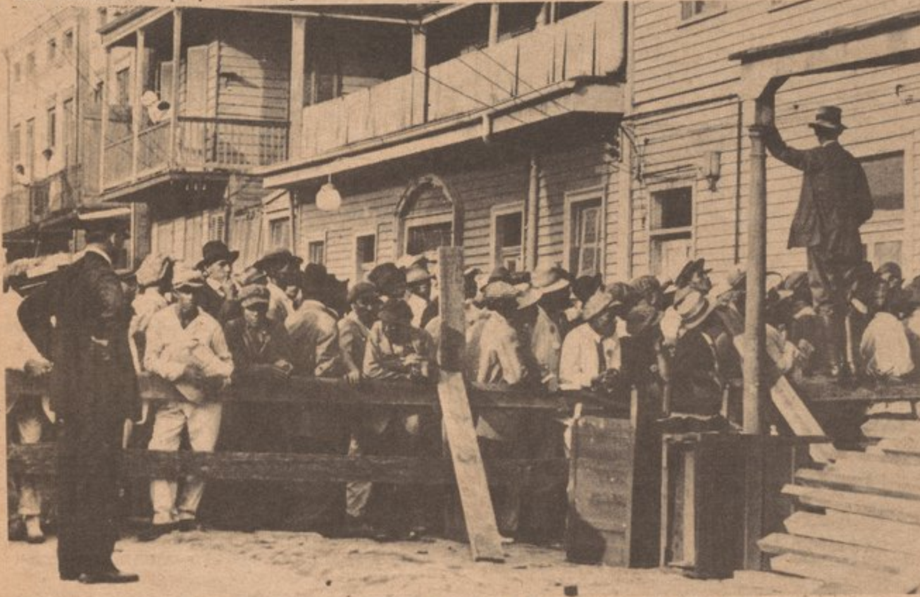
Puerto Ricans in the late 30's registering for the construction of housing in New Orleans.