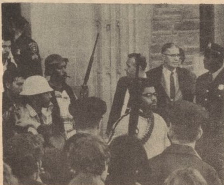
Estudiantes Negros armados salen del edificio ocupado por ellos en el campus de Cornell University, 1969.

decayente. El pueblo indochino ha sido victorioso. Asia, Africa y América Latina se encuentran en llamas con el fuego de revolución. Domésticamente, las luchas de la clase obrera, la nación afro-americana, las nacionalidades oprimidas y las masas trabajadoras contra la clase capitalista han agudizado, como muestra la gran cantidad de huelgas, los paros de trabajo y las demostraciones. Para el movimiento de los estudiantes y la juventud, ya ha comenzado un levantamiento contra diferentes manifestaciones de la crisis imperialista.