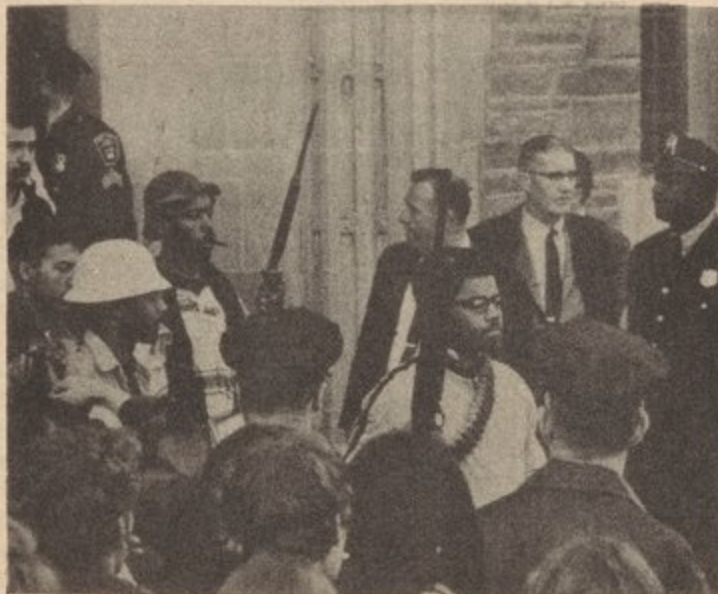
Armed Black students leave occupied building on Cornell University campus, 1969.

U.S., the struggles of the U.S. working class as seen in the rise of strikes, walkouts, demonstrations, etc. against the capitalist class, and the struggles of the Black nation, oppressed nationalities and toiling masses have sharpened. For the student-youth movement there has already begun an upsurge against the various manifestations of the imperialist crisis, as seen in the militant protest movement against the rising costs in colleges and high schools, against the cutbacks, attacks on oppressed nationalities and the rising fascist menace as seen in the racist theories of Shockly, rise in political repression as in Brooklyn College, and police murders of Black, Chicano, and Puerto Rican youth.