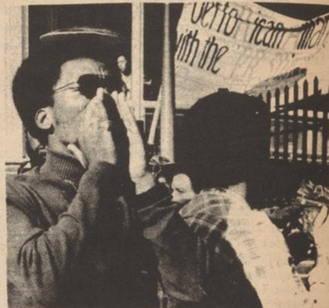
Demonstration called by Anti-Imperialist Coalition at Brooklyn College in support of students brought up on disciplinary charges by administration.

However, the Brooklyn College students did not retreat under the attack. Instead, they intensified