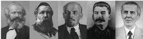
Karl Marx, Friedrich Engels, Vladimir Lenin, Joseph Stalin, Enver Hoxha 5 Classics of Marxism

Comintern (Stalinist-Hoxhaists) http://ciml.250x.com