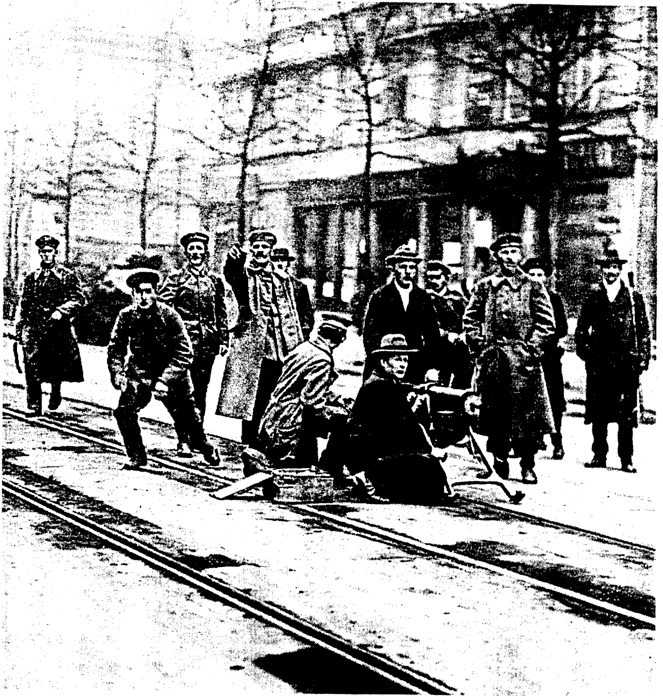
WÄHREND DER BESETZUNG des Berliner Zeitungsquartiers am 5. Januar 1919