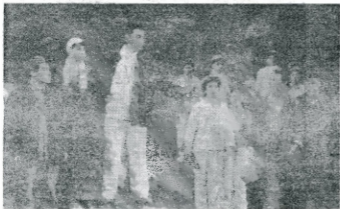
El drama moderno Batalla , es el estilero.

La adaptación de obras escénicas revolucionarias modelo también permitió que la ópera zhuang se desarrollara de nuevo y sanamente. Esta forma de ópera, que goza de popularidad en las zonas de la nacionalidad chuang de Kuangsi, sur de China, estaba agonizante artísticamente. El conjunto de ópera zhuang que tomó parte en el festival adaptó dos actos de Batalla en la planicie , otra ópera de Pekín acerca de la Guerra de Resistencia contra el Japón. Sin perder las características musicales de la ópera zhuang, los artistas aprovecharon lo valioso de las canciones folklóricas y de otros tipos de ópera, enriqueciendo la música zhuang de tal manera que podía expresar mejor las magníficas aspiraciones de los