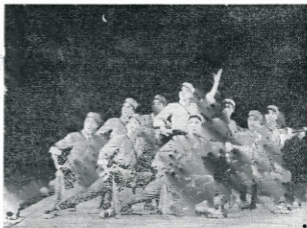
Shuchiapang , ópera de Pekín revolucionaria modelo adaptada a la ópera luang de Junán.

*Hasta ahora hay 17 obras escénicas revolucionarias modelo. Incluyen las óperas de Pekín modernas revolucionarias La ingeniosa conquista de la Montaña del Tigre , La linterna roja , Shuchiapang , En los muelles , Asalto al Regimiento del Tigre Blanco , Oda a Luogehuang , El destacamento rojo de mujeres , Batalla en la planicie y El monte de los Asesnes ; los ballets modernos revolucionarios El destacamento rojo de mujeres , La muchacha de los cabellos blancos , Oda a Yimeng y Las hermanitas de la pradera ; la música sinfónica Shuchiapang y La ingeniosa conquista de la Montaña del Tigre ; arias de la ópera de Pekín La linterna roja con acompañamiento de piano, y el concierto para piano El río Amarillo .