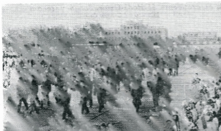
El Presidente Bongo y señora son recibidos calurosamente en el aeropuerto de Pekín

Gran Palacio del Pueblo. Asistieron por invitación los dirigentes chinos Teng Siao-ping, Wu Te y Ngapo Ngawang-Jigme y otros.