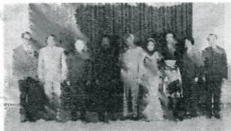
El Primer Ministro Chou con el Presidente Bongo y señora, y otros huéspedes gaboneses.

El Presidente Bongo y su señora ofrecieron el 6 de octubre un banquete de gala en retribución en el