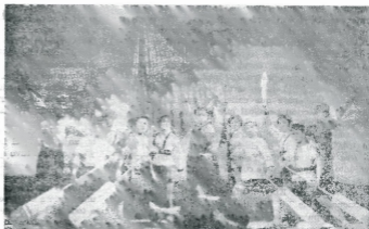
Panshitan , ópera de Pekín moderna revolucionaria.

Tomando como centro la lucha por construir un barco de 10.000 toneladas en una pequeña grada la