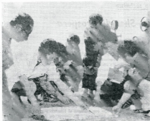
Los obreros, cuadros y técnicos discuten medidas para asegurar un rendimiento alto.

zos de alto rendimiento. Pero la presencia de muchas fallas subterráneas y las complicadas condiciones geológicas crearon muchos nuevos problemas y dificultades a la prospección y la extracción. Combinando un alto espíritu revolucionario con una actitud estrictamente científica y aprovechándose con la afilada arma del