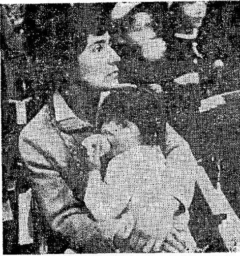
* UNA MADRE PROLETARIA, con su hija en brazos, escucha atentamente la intervención del dirigente de su Partido. Hombres y mujeres del pueblo testimoniaron con su fervorosa presencia, la confianza que siente el pueblo en la acción política del Partido Comunista.

"hibiremos al Partido Comunista y lo disolveremos porque es un Partido criminal".