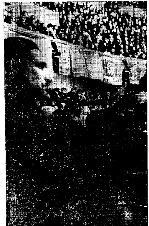
* EL CAUPOLICAN se repitió de gente para las la actuación del Partido Comunista.

Los que fueron a apedrear la Embajada soviética en Santiago, miembros del partido de los momios y de Fiduicia, encabezados por el diputado Monckeberg, jamás han movido un dedo ni pronunciado una palabra contra los actos de intervención del imperialismo.