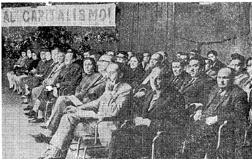
* EL COMITÉ CENTRAL del Partido recibió, junto al Secretario General, las expresiones del gran afecto que siente el pueblo chileno por sus dirigentes.

Nosotros estamos, ya dijimos, por la democratización socialista y ésta implica que la clase obrera y el pueblo ejerzan en términos cada vez más amplios y efectivos el poder. Lo demás es democratización burguesa y conduce a la restauración del capitalismo. Que nadie olvide esto.