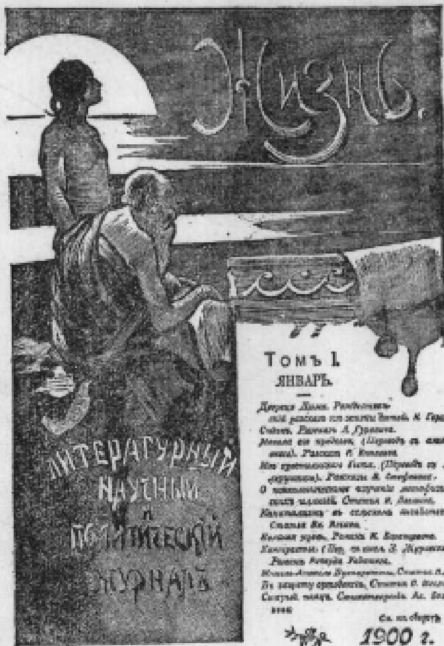
1900 年载有列宁《农业中的资本主义》 一文的《生活》杂志的封面 (按原版缩小)