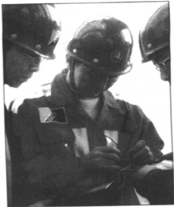
做不了科学家，就做能工巧匠。

头扎进自己的小屋里反复揣摩。一块书本大的模板，上面是嵌入的几百个电子元件，下面是弯弯曲曲的印刷电路，这样的模板在桥吊上一共有 20 块！盯着模板正反两面小得像蚂蚁一样的 2000 多个焊点，再仔细观察各种不足半个厘米长的电子元件，他认真地进行模拟勾画。为了分辨细如发丝、若隐若现的线路，他用玻璃板制作了一个简易支架，将电路板放在玻璃