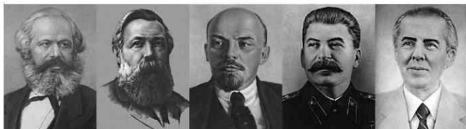
Karl Marx, Friedrich Engels, Vladimir Lenin, Joseph Stalin, Enver Hoxha 5 Classics of Marxism