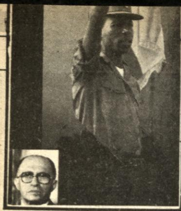
اثناء الاحتفالات صور كوسيفين ومنغستو أمام النصبة