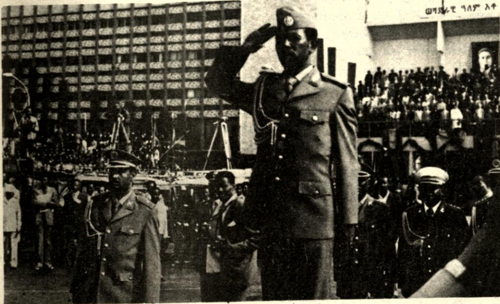
منفتحو اثناء احتفالات الذكرى الخامسة للثورة

من المهمات العملية التي ترجع الى اللجنة المنظمة للحزب ، سيكون اختيار وتثبيت اولئك الشيوعيين الحقيقيين الذين وقفوا باستمرار بجانب الجماهير وبجانب تحررها السياسي والاجتماعي والاقتصادي ، والذين بويعهم السياسي ، وتقاتلهم وعدم انانيتهم : نظمو انفسهم في مجرى النضال الطبقي المقدس . وبخصوص عمل اللجنة فطبيعي انها سوف تبحث